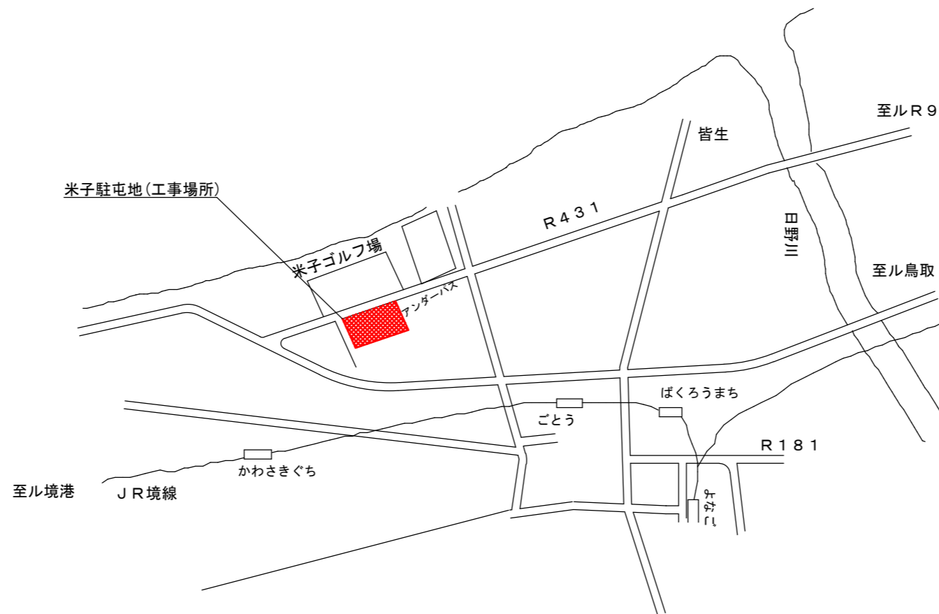
米子駐屯地案内図 NON SCALE