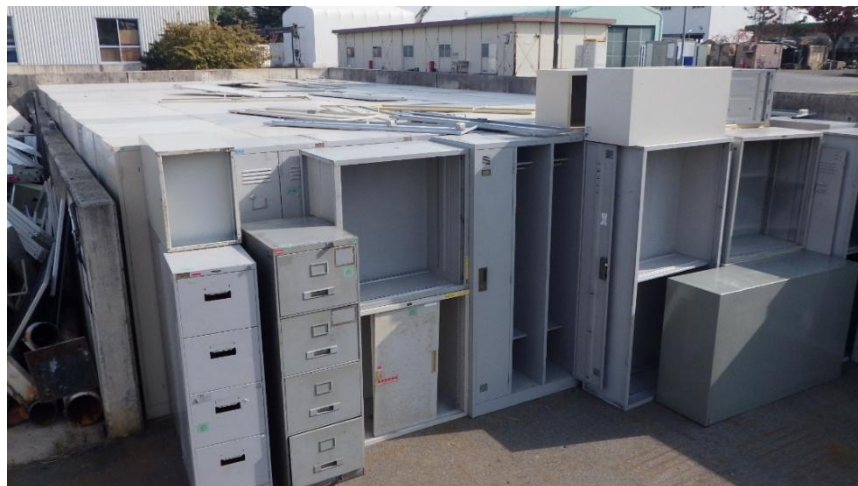
ロッカー・書庫等