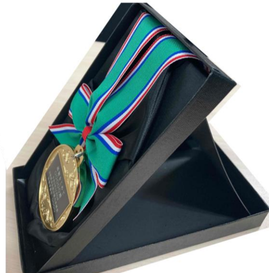
【化粧箱に収納した状態】