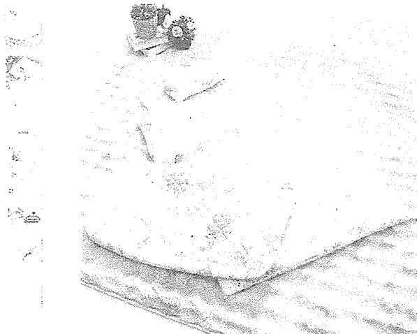
お昼寝布団セット 動物