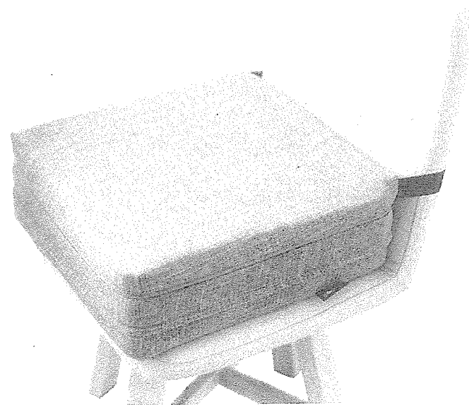
Emul baby chair (Light Gray) (1)