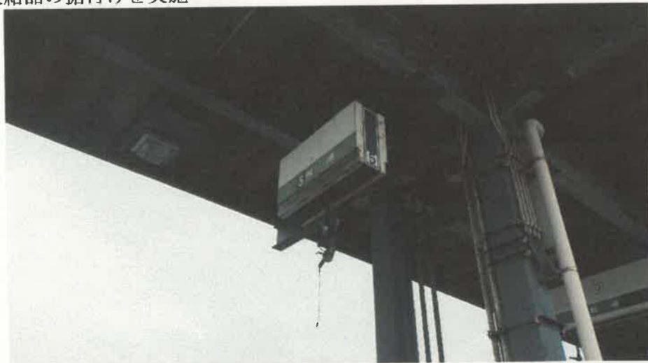
燃料計量機（海田市駐屯地 給油所 更新機材）