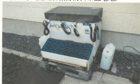
エアシューズクリーナー