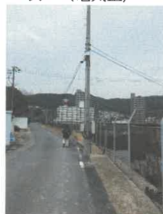
表 6 (電気室)