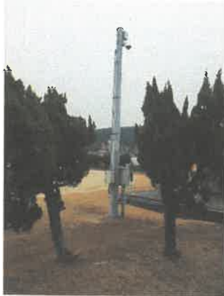
表 4 (渡河訓練場)