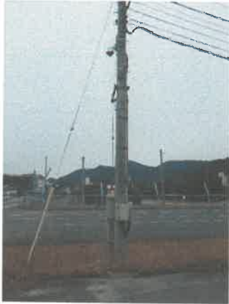
表 1 (北門 3)