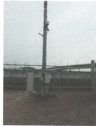
表 3 (滑走路北)