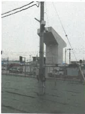
表 2 (グラウンド北)