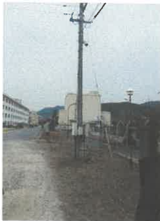
表 5 (西門)