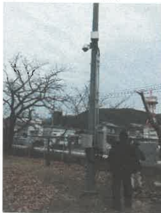
表 7 (プール南)