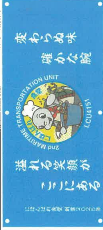
図：イメージ「横断幕」

材質：ターポリン（防災仕様） 仕様：W200xH90cm程度、上下6カ所ハトメ加工