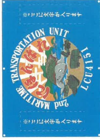
図：イメージ「横断幕」

材質：ターポリン(防災仕様) 仕様：W250xH180cm程度、上下6カ所ハトメ加工