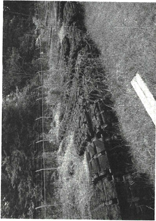
ゴム履帯52本置場付近