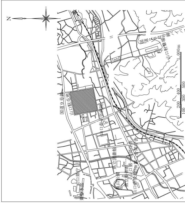
案内図 S = 1/X