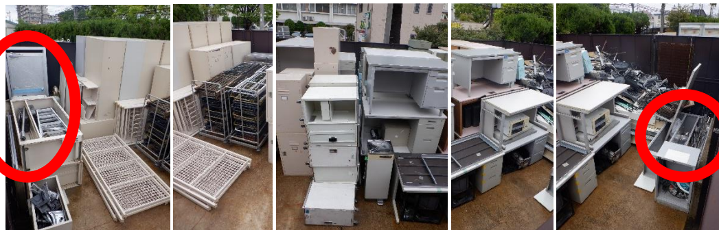
入口右側：ステンレス屑