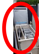
入口左側：アルミ屑