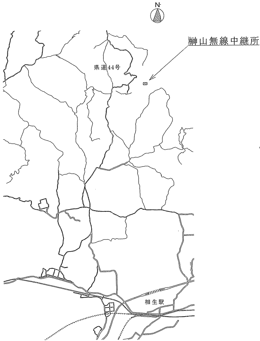
神山無線中継所 案内図 S=1/100,000