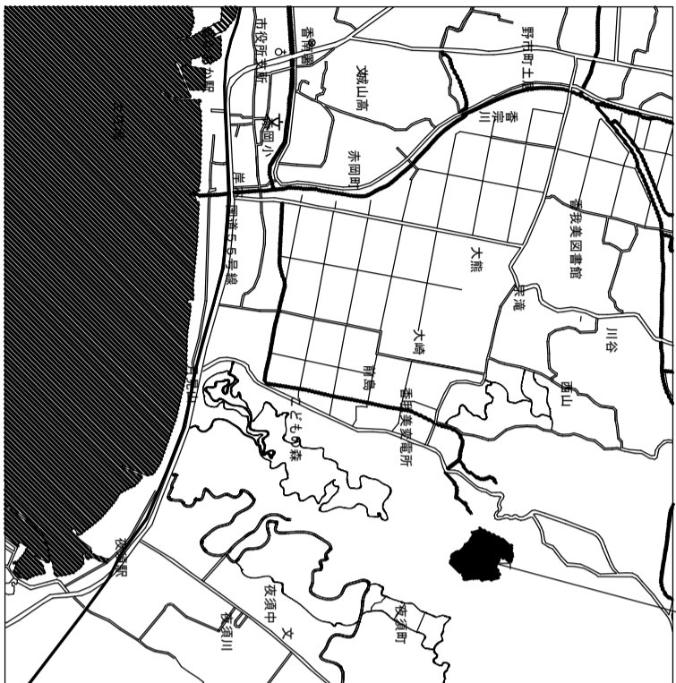
高知駐屯地 案内図 S=1/X