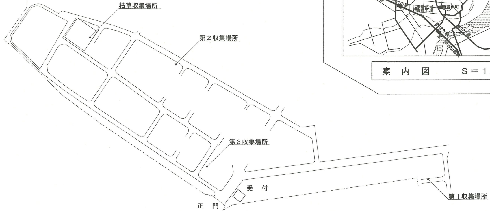
配置図 S = 1 / 3, 000