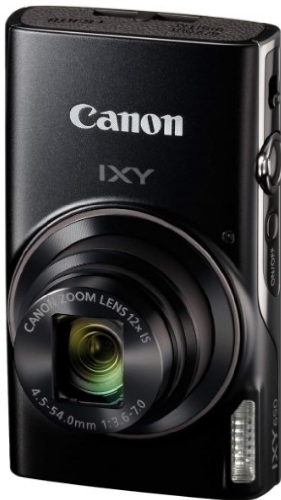
画像にマウスを合わせると拡大されます