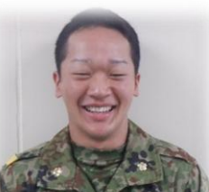
第110教育大隊 333共通教育中隊 一般陸曹候補生課程

しかし、その環境の中で仲間と支え合いながら1つ1つの任務を真剣に取り組んでいく事で、自分の中に変化が生まれました。精神面では時間や規律を守るといった責任感が生まれ、身体面でも持久力や筋力がとも向上しました。そして集団生活や各種勤務で協調性やリーダーシップの重要性を身を持って学ぶことが出来ました。特に自分が成長したことは射撃です。当初は的に当たらず0点という点数を出してしまい落ち込んでいたのですが、区隊長、区隊付、班長など様々な方に根気よく指導して頂き、徐々に点数を伸ばしていく事が出来ました。班の中でも一番下手だったのに、班の中でも上位に位置するぐらいの点数を伸ばすことができ、自分の中でも成長を感じることが出来ました。 最後にこの教育において自分を鍛え直し、人として一回りも二回りも成長することが出来たと思います。これから先も、もっと成長していこうという向上心をもって自衛隊生活を頑張りたいと思います。