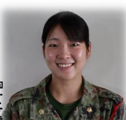
第109教育大隊 314共通教育中隊 第2区隊班付士長

前期教育で得たこの「感謝の心」、そして、一緒に数々の困難を乗り越え、笑いあった同期との思い出を胸に刻み、自衛官として、そして、一人の人間として、さらに責任感と誇りを持って歩んでいきたいと思っています。