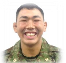
第110教育大隊 332共通教育中隊 一般陸曹候補生課程

私は、これまで自衛隊のような集団生活を行い全員で一つの事を成すために取組むという事が初めてであり、入隊後不安に思う日々が続いていました。同期と共に協力しながら訓練に臨み、お互いを支え引っぱりながら歩んでいくことにより、少しずつ不安が解消していきました。その過程において区隊長や班長・班付の方々が大きく私達を手助けして下さいました。集団生活とは何なのかという事を考え、同期の言動や要員の方々のお話を聞いていくとともに、「集団生活とは、どうやって同期に合わせるかではなく、自分が同期に対して何が出来るかを思考し、実行しながら生活していくこと。」と入隊当初に思っていたことから大きく変化していきました。 この考えを忘れないよう胸に刻み、後期教育に進んでいきます。