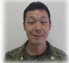
第109教育大隊 316共通教育中隊 一般陸曹候補生課程

課業後、毎日走り、班長・班付が組んでくれたメニューを毎日取り組んでいき、辛い時もありましたが時間が経つにつれ「腕立て」の回数が増え、伸びていきました。いつの間にか不安から自信へと変わっていったこと感謝しています。 この恩に報いる事は、私が入隊を助けてくれるような立派な自衛官になる事だと思います。家族にも親孝行していき、感謝される人になっていきます。この先も自分に負けず、自衛官として頑張っていきます。