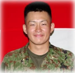
第109教育大隊 315共通教育中隊 一般陸曹候補生課程

辛い中でどう行動するか、自分の成長のためにはどうするべきか、今までの自分には無かったたくさんの考え、意識と出会うことができて、「入隊して良かった。」と心から思っています。 これから先も、「感謝」と「初心」を忘れず、立派な自衛官となるよう頑張ります。