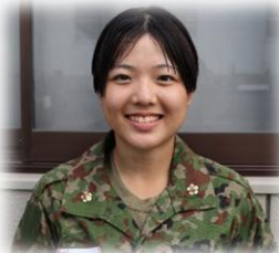
第109教育大隊 314共通教育中隊 一般陸曹候補生課程

6月下旬、第109教育大隊（大津）、第110教育大隊（松山）は、約3カ月の一般陸曹候補生課程教育を修了した。 修了行進では、前期教育の3カ月を通じて得た自信とこれからの自衛官として歩んでいく志と希望を胸に堂々とした姿を見せた。 本課程を修了した一般陸曹候補生たちは、今後職種部隊に必要な専門的知識及び技能を学ぶため全国各地の駐屯地へ羽ばたきます。