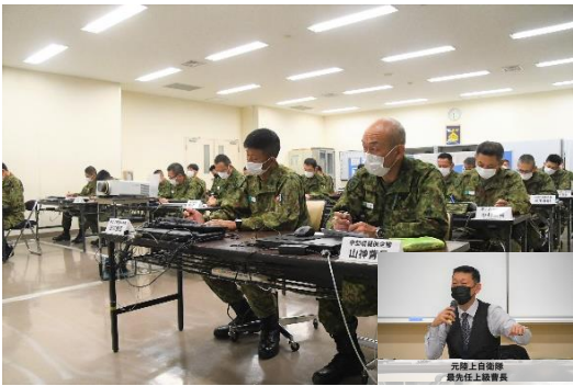
元陸上自衛隊最先任上級曹長による訓話

第4陸曹教育隊は、令和5年11月15日から、第7期最先任上級曹長課程約20名に対し課程教育を実施中です。 最先任上級曹長課程は連隊、大隊等の最先任上級曹長としての職務遂行に必要な知識及び技能の習得に励んでおります。