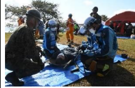
関係機関への引き渡し