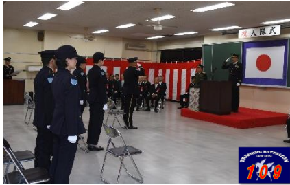
入隊式 (第109教育大隊)