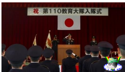
入隊式 (第110教育大隊)