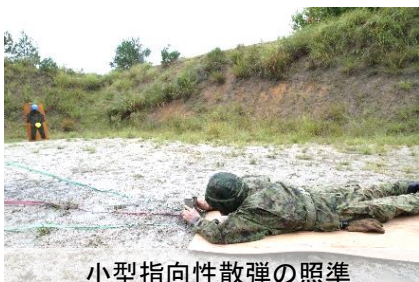
小型指向性散弾の照準

第47普通科連隊は10月上旬、あいち野営場において、連隊野営を実施した。 本野営は、約250名の隊員(即応予備自衛官約100名を含む。)が参加し、小型指向性散弾、81mm迫撃砲射撃など練成射撃及び爆破訓練を実施し、部隊の射撃・爆破能力の向上を図りました。