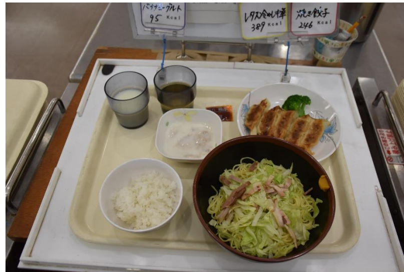
本日のメニューは冷やし中華です。