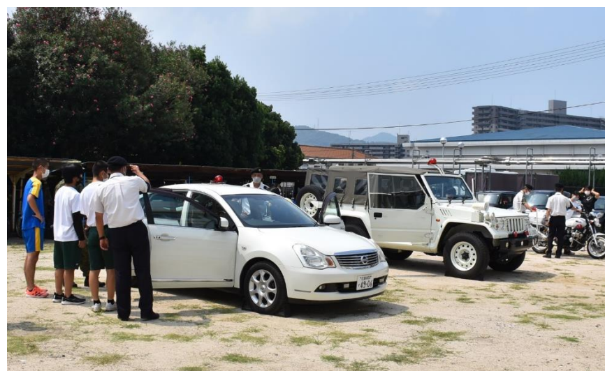
警務隊 装備車両の展示