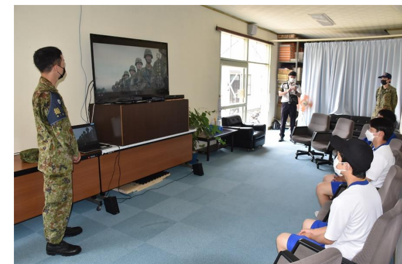
第13通信隊作成の映像を観賞