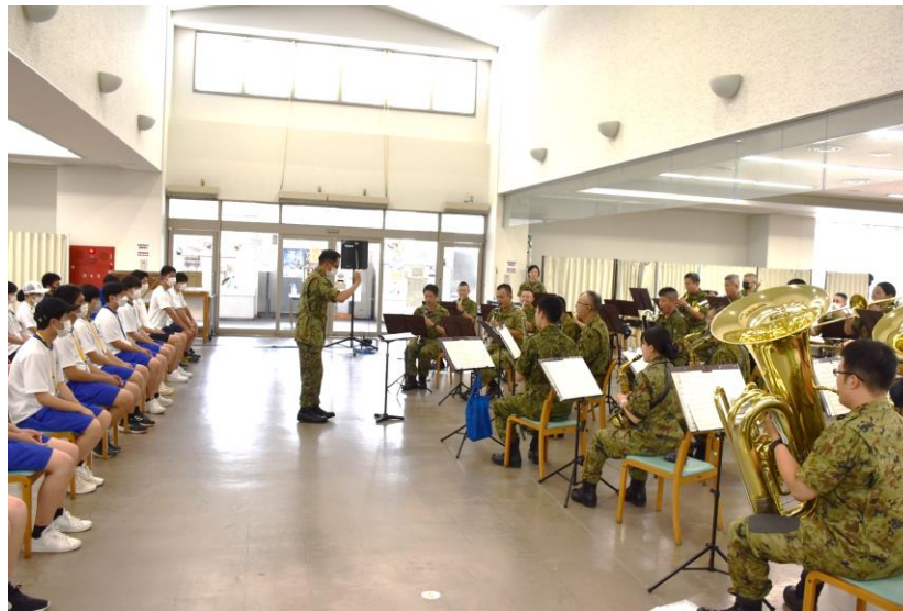
音楽隊の演奏を観賞