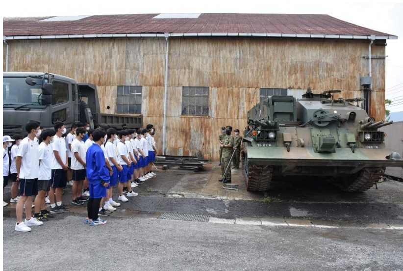
第13後方支援隊 戦車回収車の説明