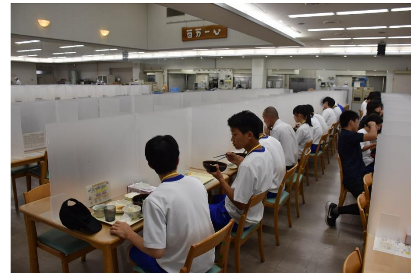
仕切りで感染対策もばっちりです。