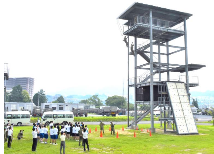
迫力のロープ降下