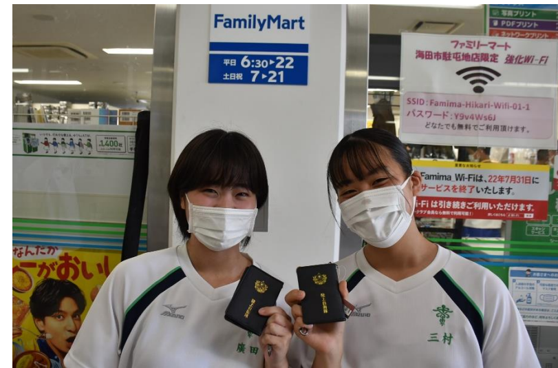
自衛隊のパスケースを購入