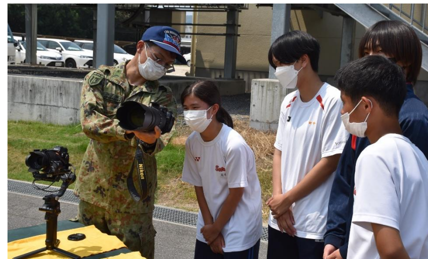
第13通信隊 撮影機材の説明