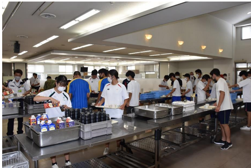
自衛官の昼ご飯を体験