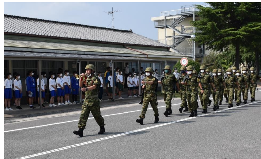
警衛隊の交替を見学

7/27 広島県内の中学生、高校生を対象にした職場体験学習を海田市駐屯地で実施しました。