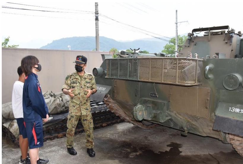
戦車の回収方法を熱心に聞いていました。