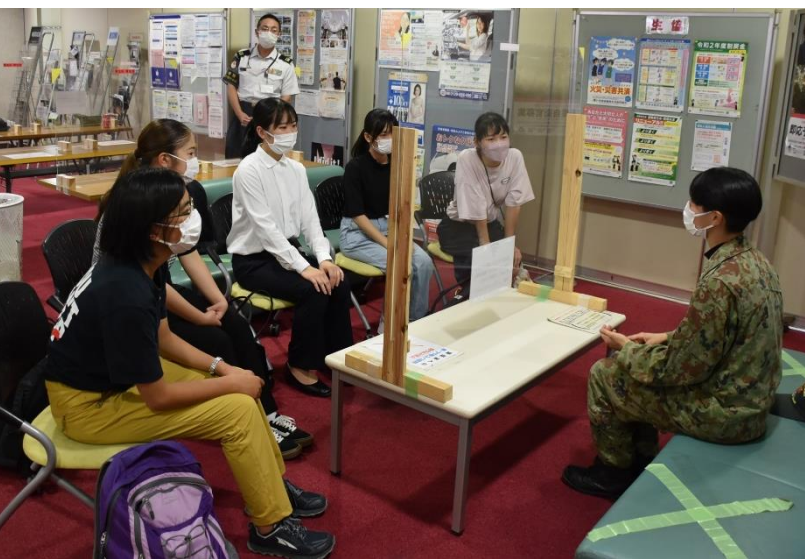
女性自衛官との懇談