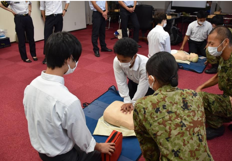
衛生隊による心肺蘇生法体験