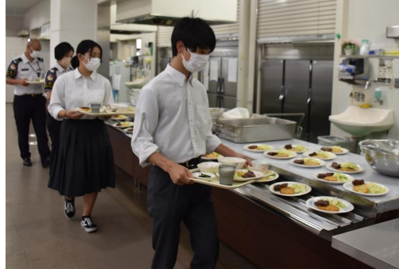
隊員食堂で喫食体験