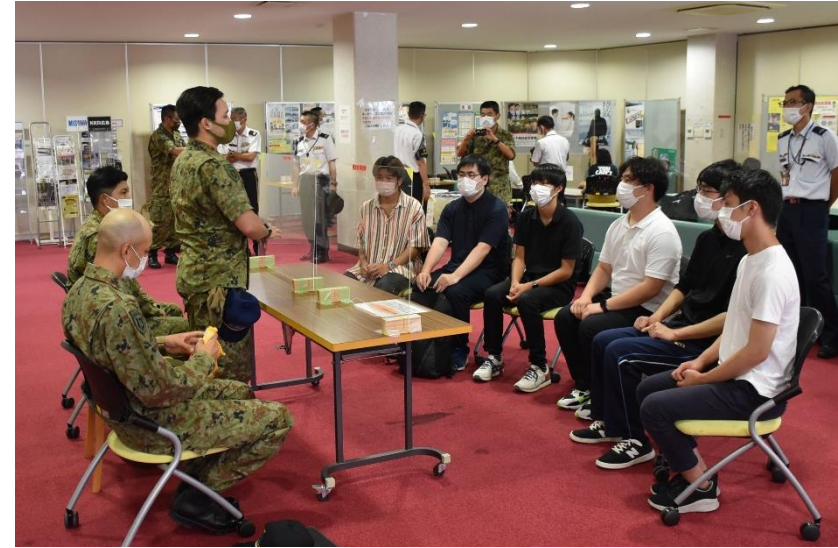
男性自衛官との懇談