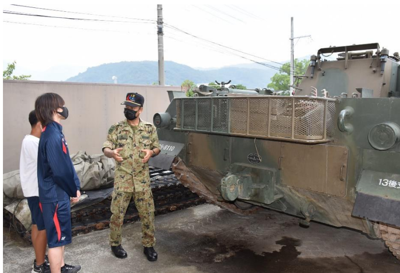
戦車の回収方法を熱心に聞いていました。