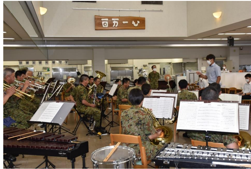
音楽隊 指揮者体験