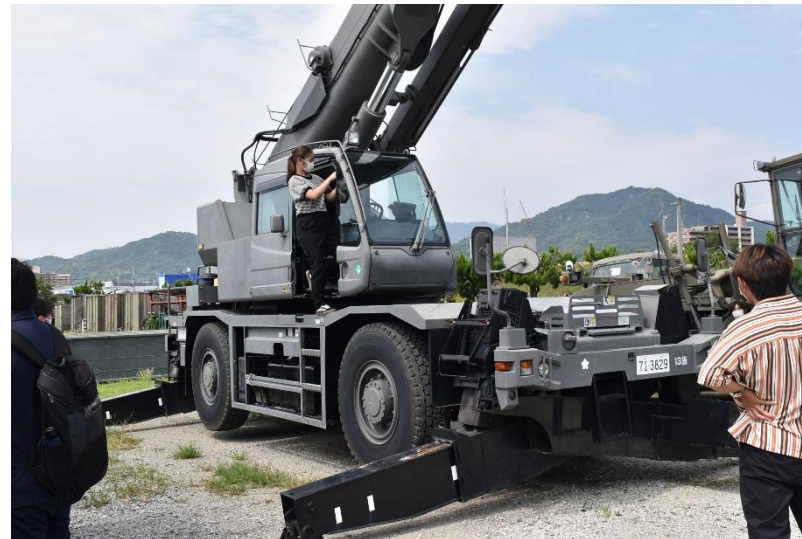
クレーン車に乗車