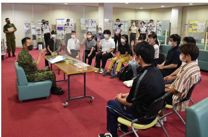
駐屯地司令との懇談