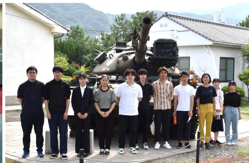
戦車の前で記念撮影