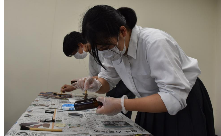
警務隊 指紋採取体験