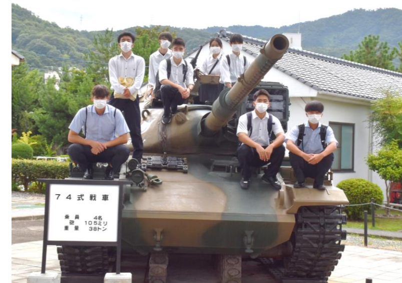
戦車に乗って記念撮影