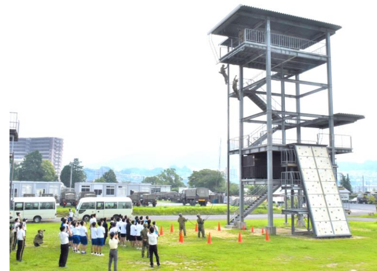
迫力のロープ降下