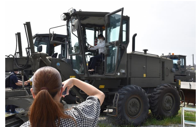
バケットローダーに乗車