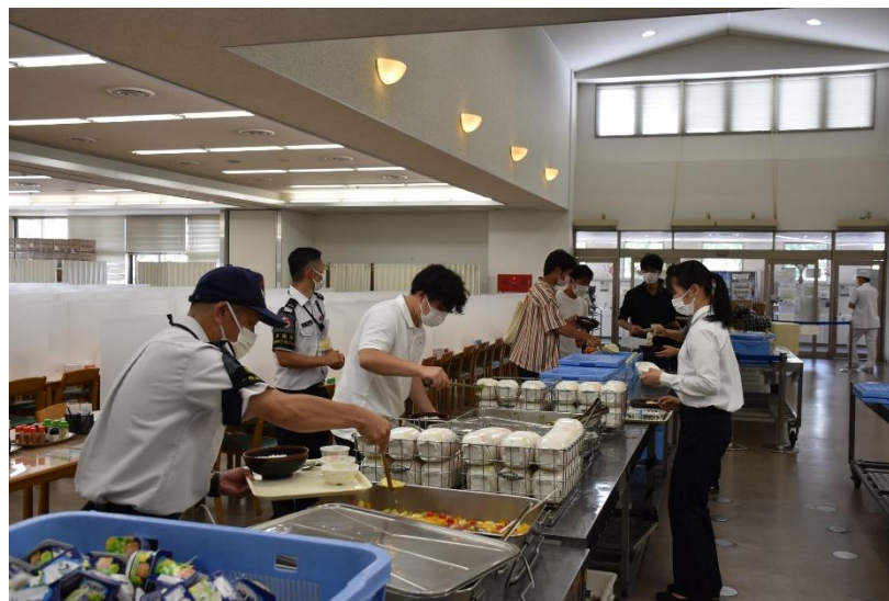
隊員食堂で喫食体験