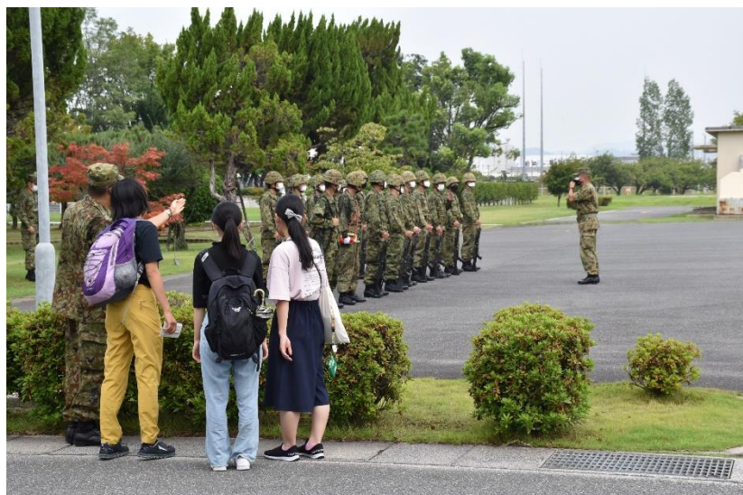
警衛隊の交代の見学