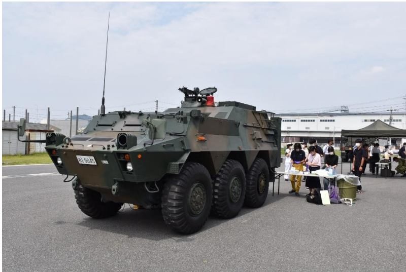
化学防護車の見学