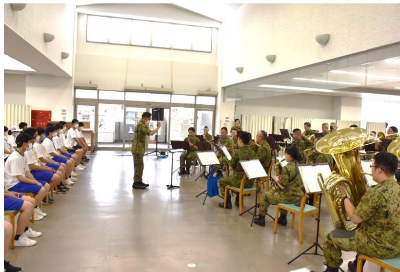
音楽隊の演奏を観賞