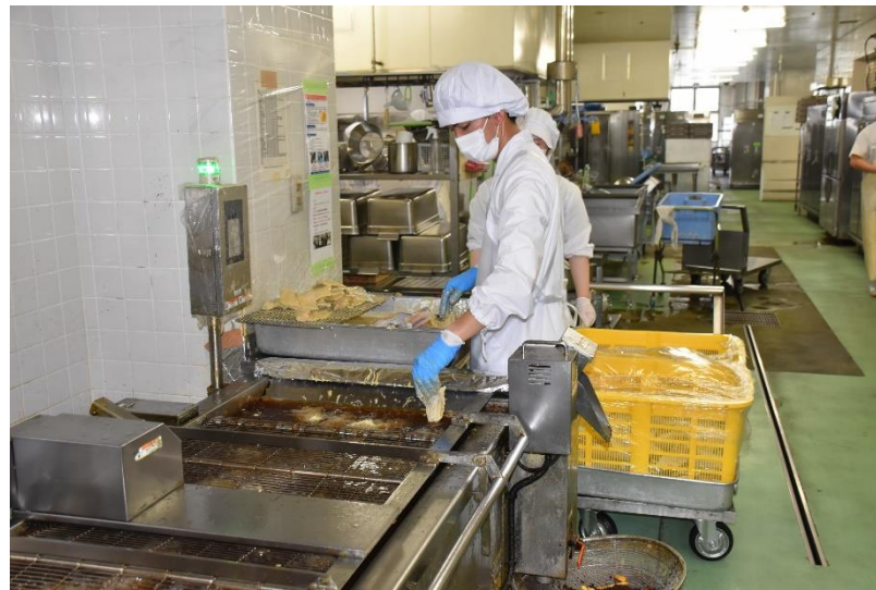
フライヤーで魚を揚げていきます。