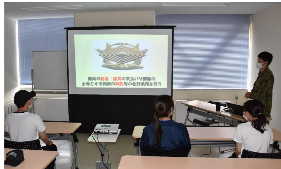
会計隊幹部による説明