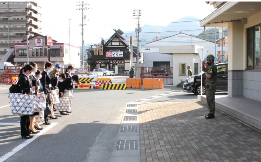
警衛隊に一礼して入門です。

9/5～9/12 比治山大学、広島文教大学の学生が管理栄養士臨地実習のため来隊しました。