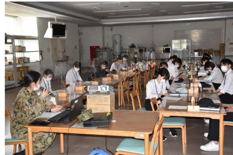
臨床検査係による衛生教育