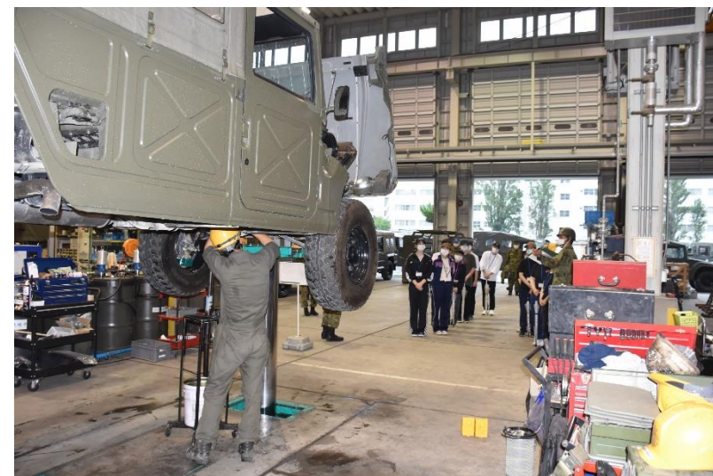
車両整備工場見学