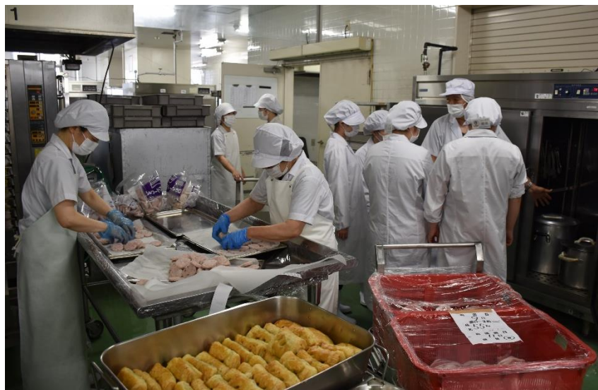
施設の案内及び説明