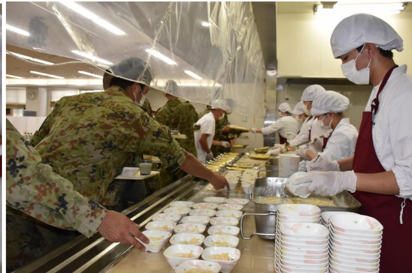
さあ、配膳開始です。