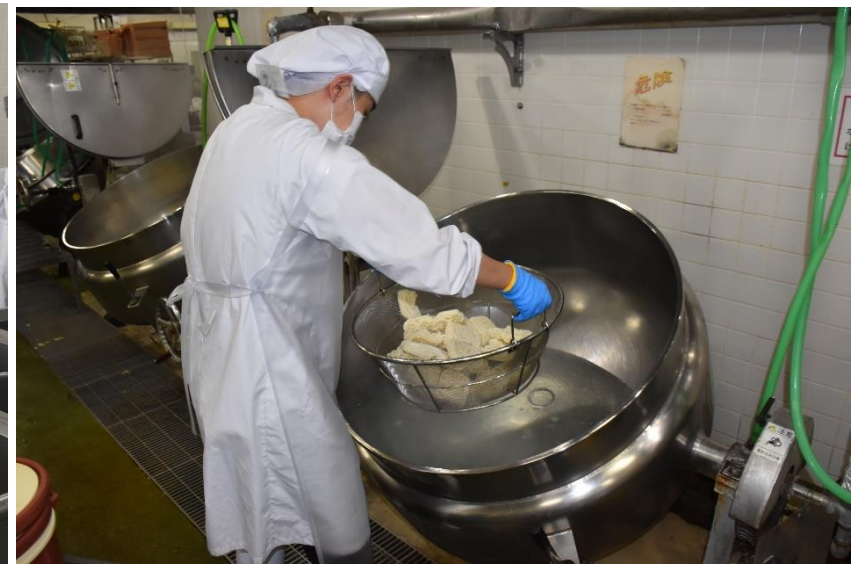
大量のうどんを湯がきます。