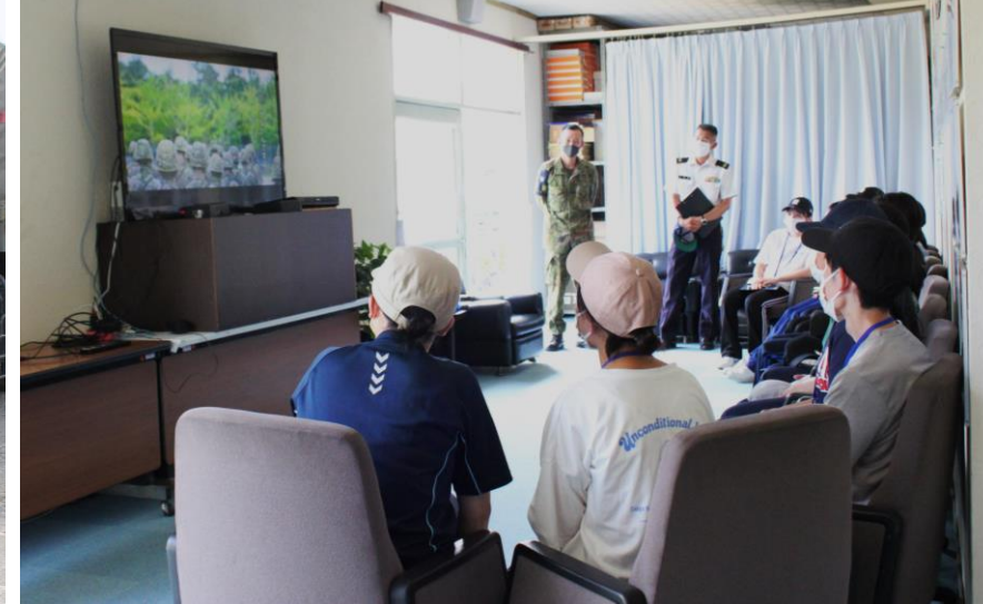
第13通信隊製作の動画観賞