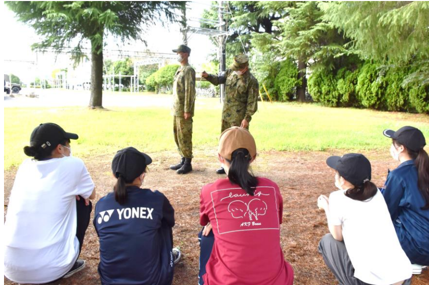
これが不動の姿勢！