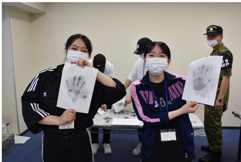
指紋採取「これが私達の指紋です。」