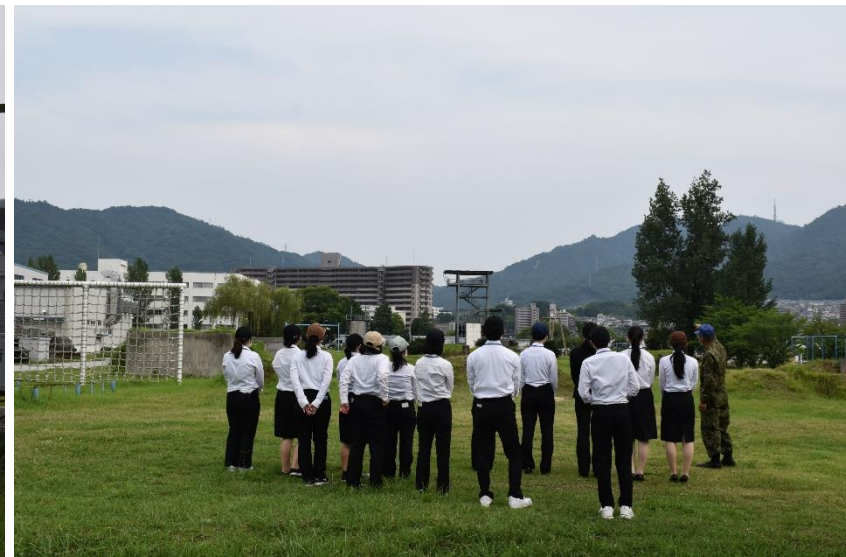
戦闘訓練場を視察