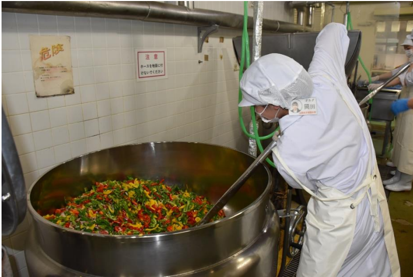
大きな釜に奮闘中！