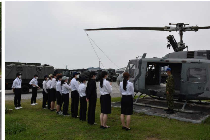
訓練用ヘリの説明