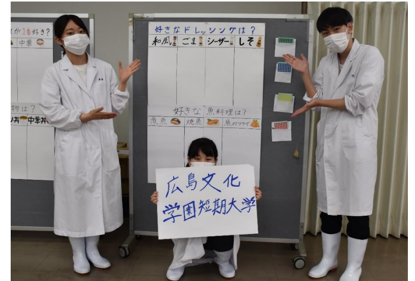
アンケートご協力お願いします。