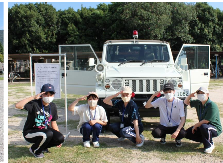
警務隊仕様の小型トラック！