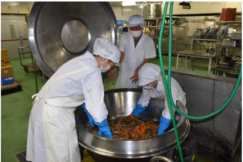
手を使ってかき混ぜます。