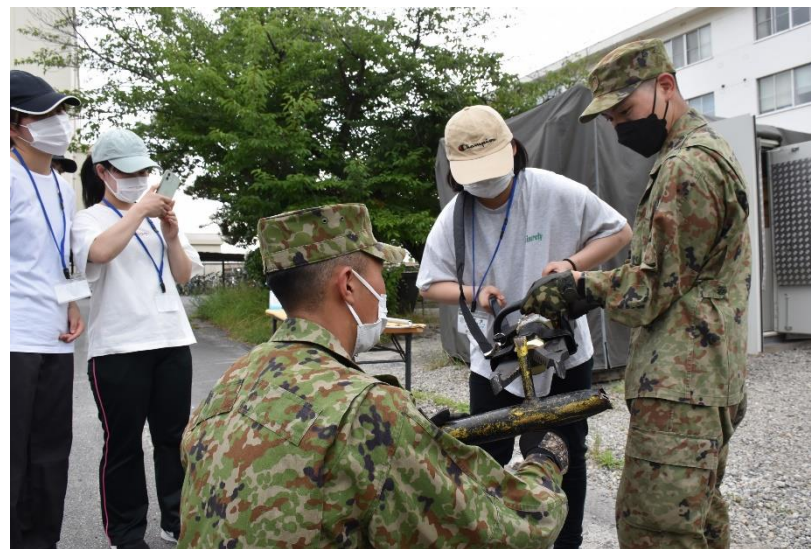
油圧式カッターで鉄骨の切断に挑戦！