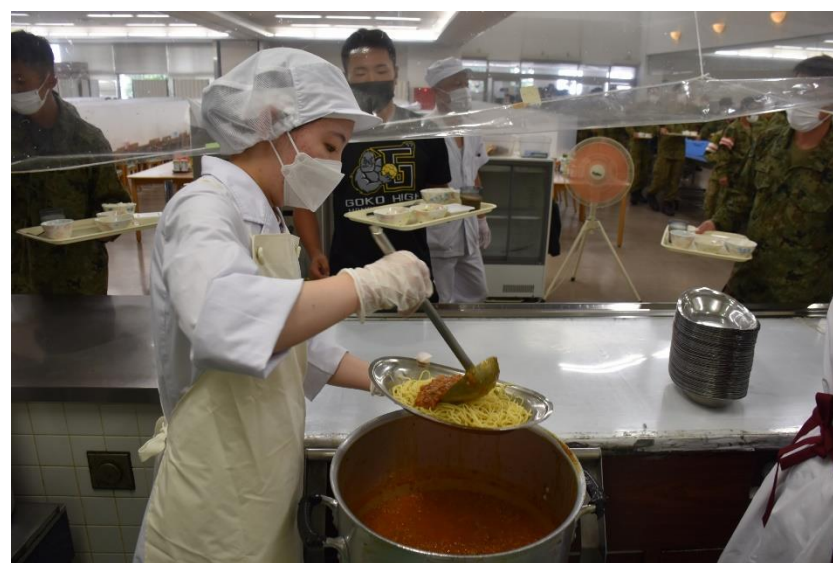
続々と隊員が来ます！