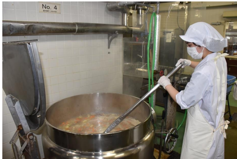
汁物はアツアツです。