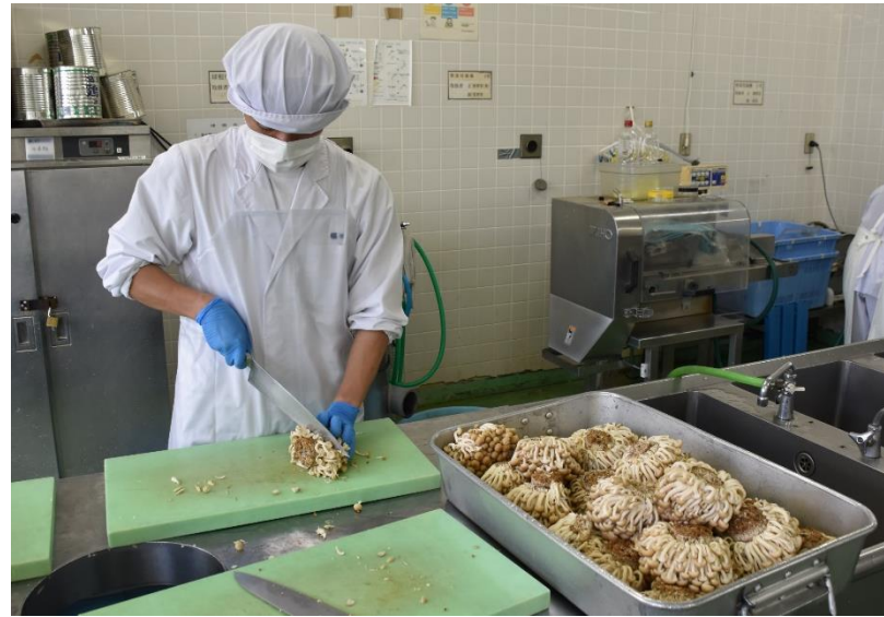
しめじも大量です。