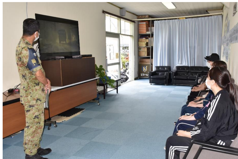
通信隊写真班作成の映像を観賞