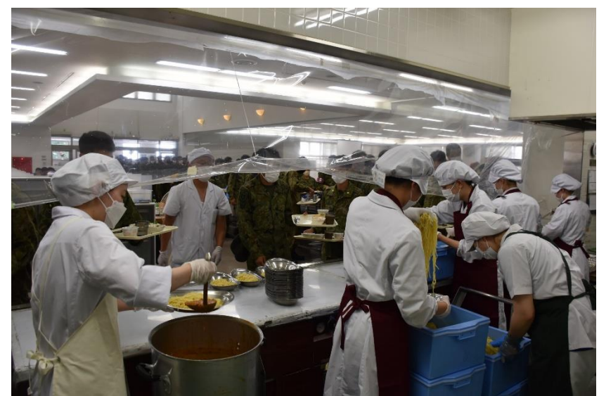
約600食の盛り付けに大忙し！