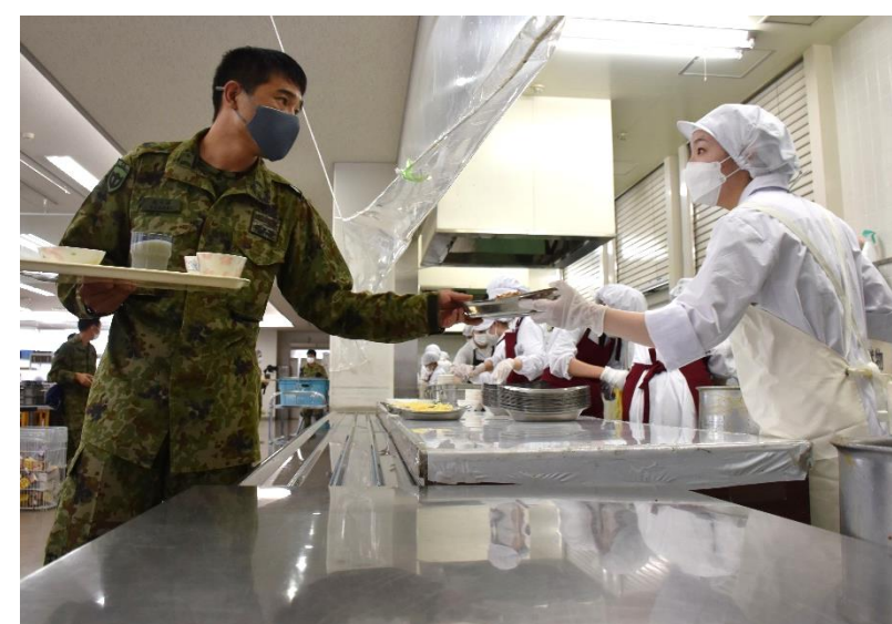
ご苦労様です！目を見て配膳します。