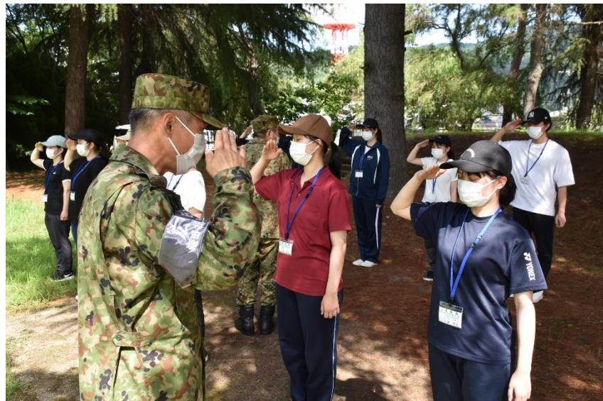
これが自衛隊の敬礼！