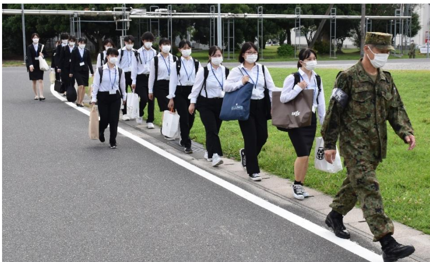
実習初日、緊張してます。

7/11～7/15 山陽女子短期大学、広島文化学園短期大学の学生が管理栄養士臨地実習のため来隊しました。