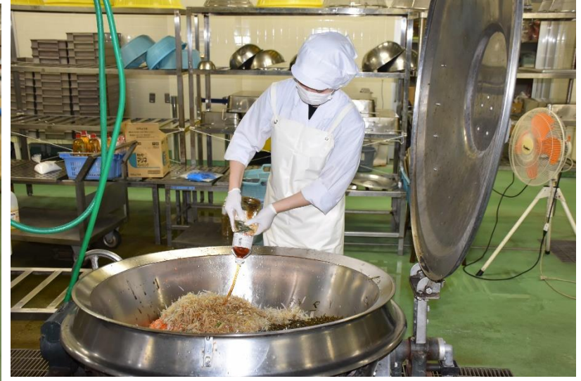
調味料も大量に使います！