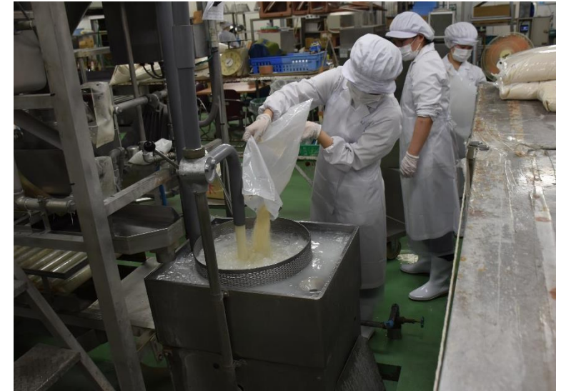
600人分の米を炊いていきます。