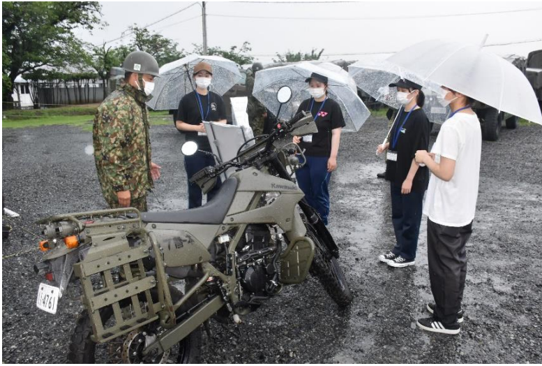
偵察用オートバイ！