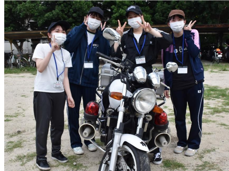
自衛隊にも白バイがあります。