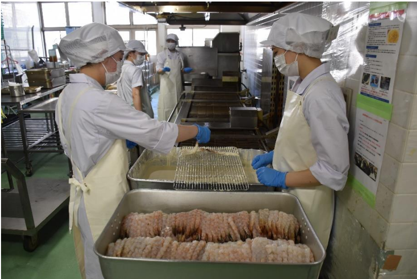
海老の天ぷらです。