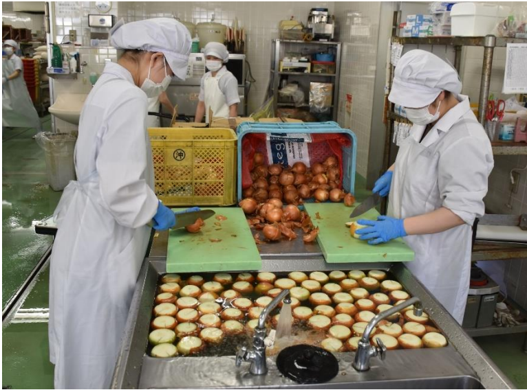
玉ねぎの下処理中！