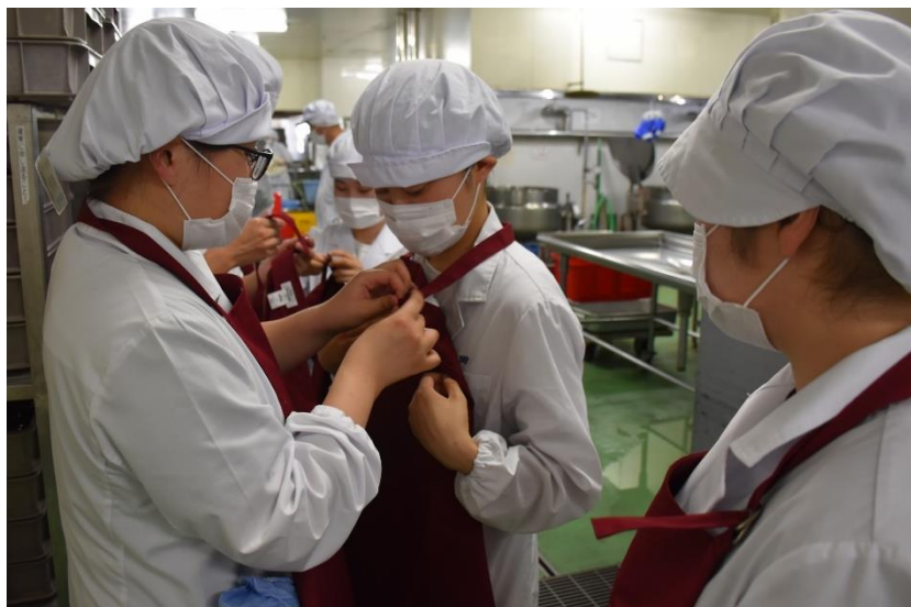
エプロンをつけて配膳準備です。