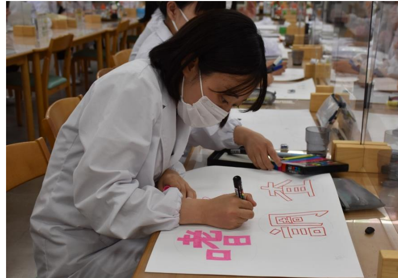
嗜好品調査のパネル作成