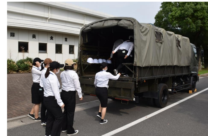
実習の後は駐屯地の見学です。