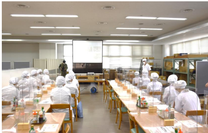
糧食班長から実習の説明です。