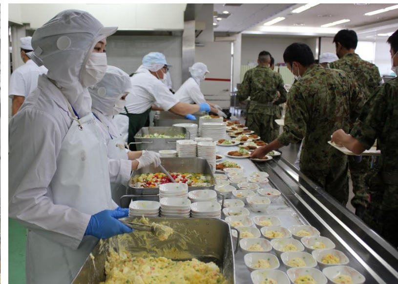
隊員達が続々とやって来ます。