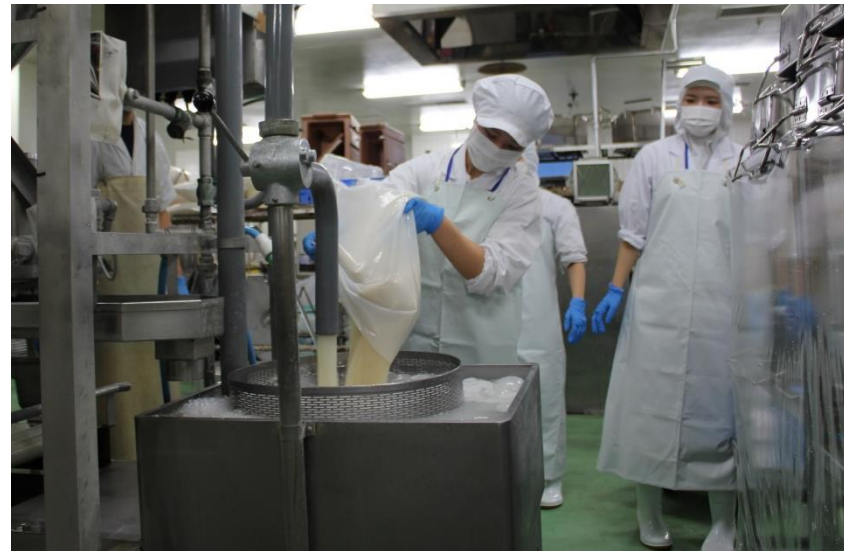
大きな炊飯器で米を炊いていきます。