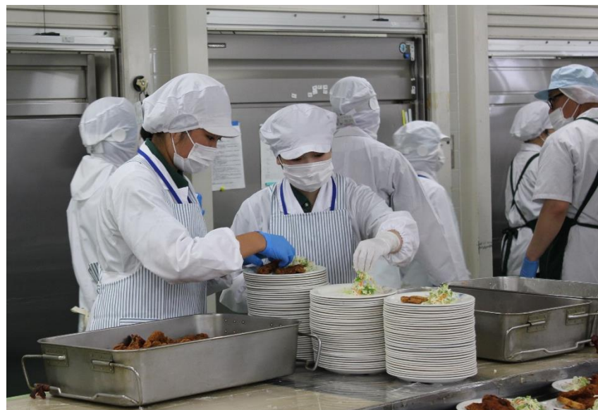
昼食の配膳準備です。