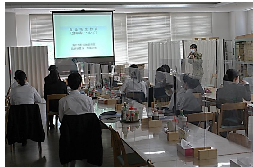
臨床検査係による衛生教育