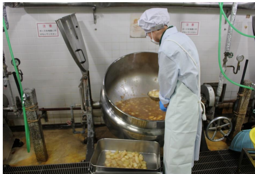
大きな窯で大量に調理していきます。