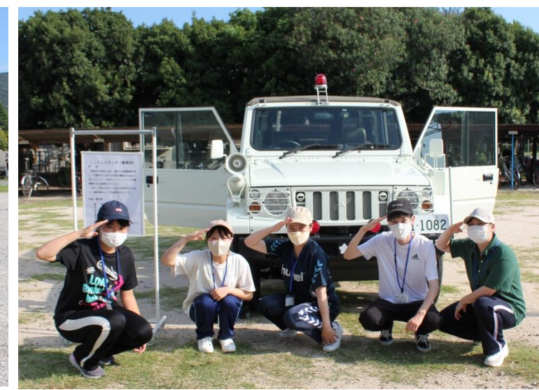
警務隊仕様の小型トラック！