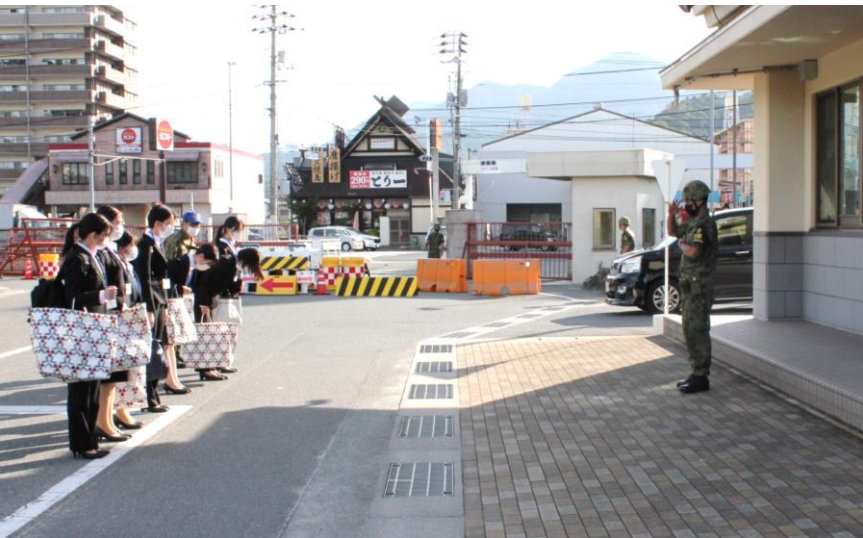
警衛隊に一礼して入門です。

9/5～9/12 比治山大学、広島文教大学の学生が管理栄養士臨地実習のため来隊しました。