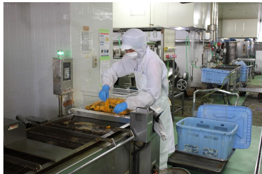
カボチャの天ぷらを揚げていきます。