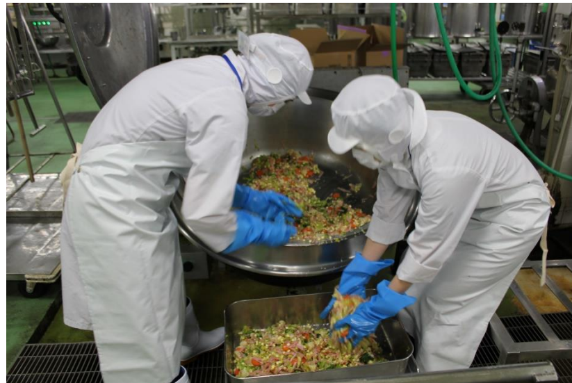
両手を使ってしっかり味付けします。