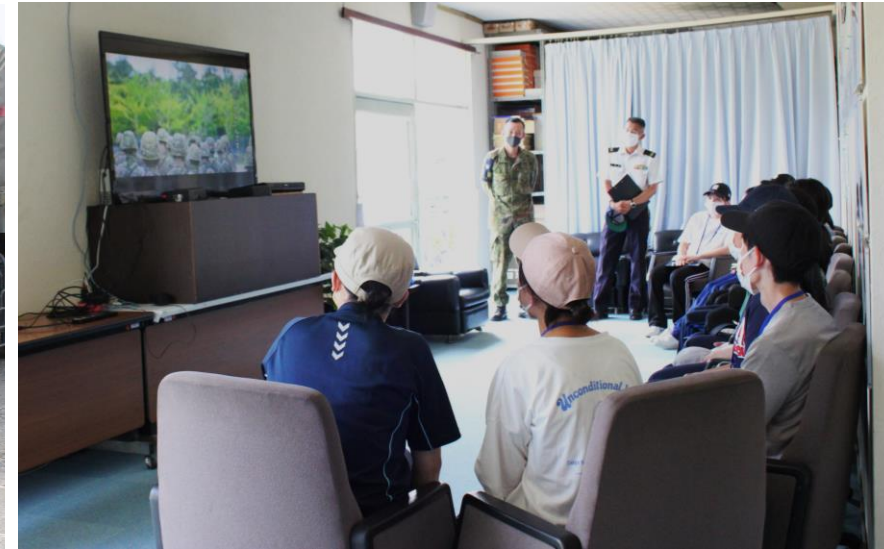
第13通信隊製作の動画観賞