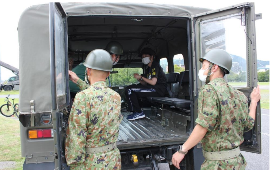
高機動車乗車体験！