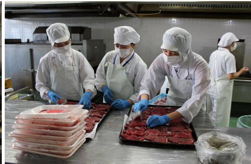
ステーキの仕込み