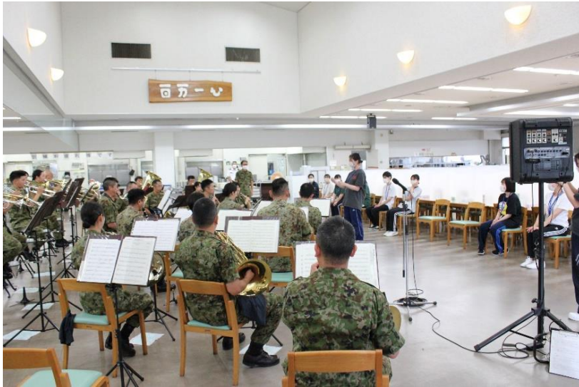
第13音楽隊の指揮者体験