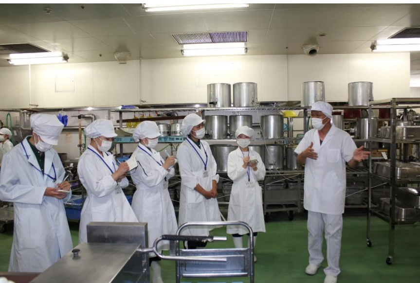
施設の案内及び説明