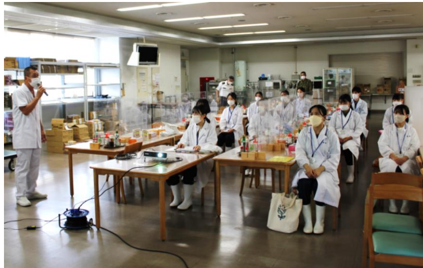
糧食班長から実習の説明です。