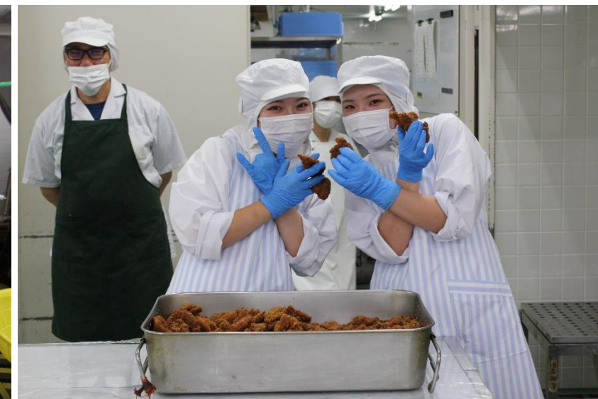
だいぶ余裕が出てきました。