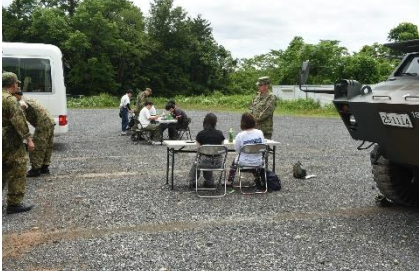
戦闘糧食体験喫食