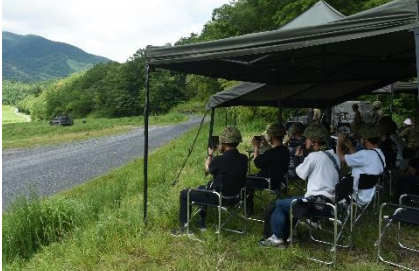
必死に撮影される皆さん