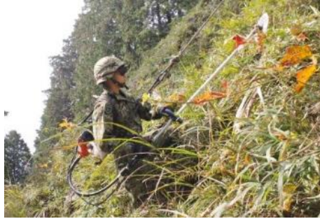
東弾着地の除草 （日本原）