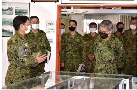
施設巡視（日本原駐屯地）