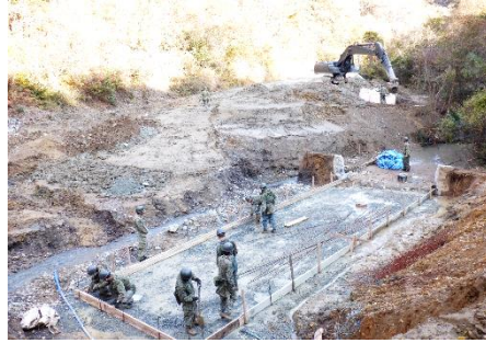
上古賀南橋道災害復旧整備 （あいば野）