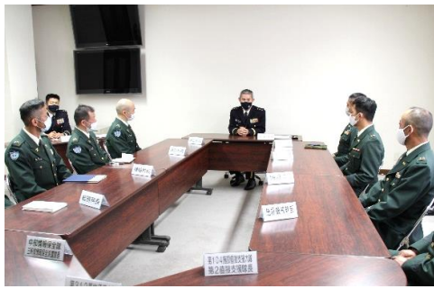
部隊長との懇談（三軒屋駐屯地）