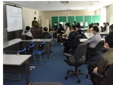
自治体担当者への概要説明

参加者は、募集対象者、保護者、学校教諭等で、約180名に及んだ。また、愛知県同県内市町村の募集業務担当者も参加は、じ後の業務協力に多大な資を与える機会となった。