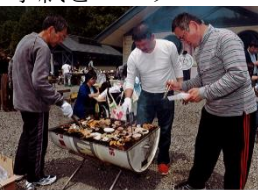
家族会主催BBQ大会（平成30年）

令和元年8月、第2科長に上番して早1年が経過しました。「明日の天気どうなの？」と指揮官に問われたら「負けたらどう思っていますか？」「求められる前に提供せよ」を要望事項とし、情報所掌部署として、常に先行的な情報業務を実施するように心がけています。情報とは何なのか？例えば、明日登山をする、釣りに出かける、ゴルフに行く、遊園地に行く、そんな時、明日の天気、場所、交通手段・それらに何のリサーチもせずに出かける人がいるでしょうか？なりません。天気一つで予定が中止になることもあるでしょう。我々は日常的に、あらゆる場面で自分に必要な情報を収集し、それを基に決断し行動しています。「明日は晴れです。」「は、ただの天気予報です。このご時世スマートフォンがあればいつでも手に入る情報です。」「明日は晴れます。だから・・・」この先が大事です。晴れることにより、部隊に与える影響は良いことばかりではありません。熱中症が発生するかもしれない、あるいは林野火災が発生するかもしれない、その「かもしれない」をいくつ列挙し、指揮官に報告すること出来るか？まだまだ考察は足らず、勉強の毎日です。