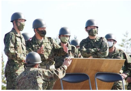
中部方面総監現地視察 （あいば野）