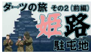
ダーツの旅（第1弾～第2弾）