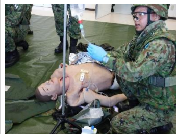
緊急救命行為を行う隊員

10月26日（月）から30日（金）の間、中部方面衛生隊長（隊長 岡部1佐）を担任官とし、第一線救護衛生員練度維持集合訓練が実施された。訓練には師・旅団及び方面直轄部隊から計10名が参加し、緊急救命行為に資する訓練及び練度判定を通じて、第一線救護に必要な練度の維持向上を図った。