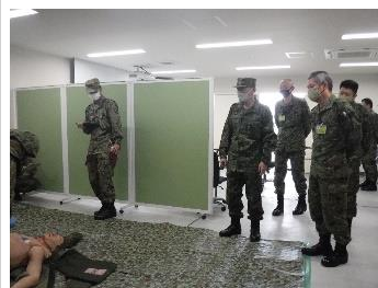
中部方面総監による視察