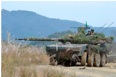
警戒しながら射座へ前進する16式機動戦闘車