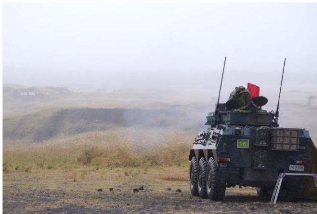
87式偵察警戒車による射撃