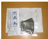
業務隊長からの手紙とマスク

今年度は、新型コロナウイルス感染症拡大の影響を踏まえ、厚生科隊員がマスクを作成しました。そのマスクとともに飛鳥及び隊長からの手紙を直接お会い出来ない家族会会長等に郵送した結果、好評をいただき、制約のある中においても更なる信頼関係を醸成することができました。今後は、隊員に対する施策の理解を深化させるとともに、関係部外団体との更なる施策の推進に努めていく所存です。