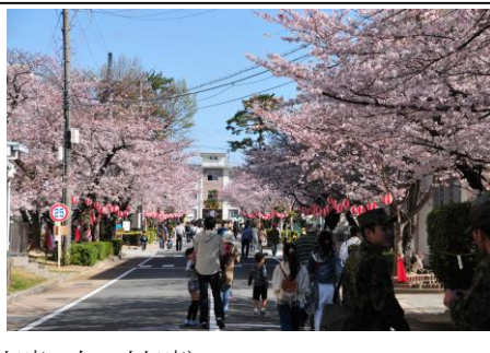
伊丹駐屯地 (左：今年度 右：昨年度)