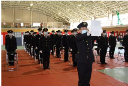
宣誓を行う候補生 (山口駐屯地)

4月上旬、方面区内の各駐屯地において、一般曹候補生及び自衛官候補生の入隊式が行われた。