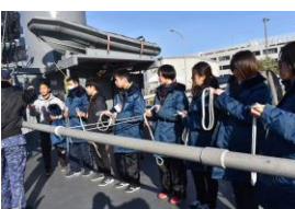
ロープの結び方を学ぶ参加者