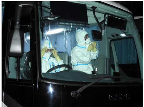
輸送支援に向けた防護服の準備 (関西国際空港)

また、第3師団（師団長 梶原陸将）、第10師団（師団長 鈴木陸将）、第13旅団（旅団長 山根陸将補）、第14旅団（旅団長 藤岡陸将補）、中部方面衛生隊（隊長 岡部1佐）は、各地において、市中感染対応に係る災害派遣等（宿泊施設における生活支援、教育支援及び輸送支援）を実施した。