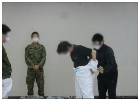
防護服着脱要領の説明