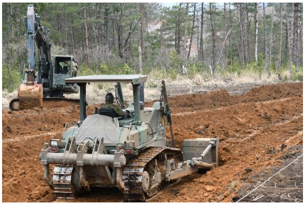
連絡道新設整備 (あいば野)

中部方面隊(総監 野澤陸将)は、4月13日(月)から20日(月)までの間、第3師団長及び第13旅団長を担任官とし、あいば野演習場及び日本原演習場において「令和2年度方面隊統制演習場春季整備」を実施した。 今回の演習場整備では、約2,300名が参加し、新型コロナウイルス感染症対策を徹底しつつ、各射場、機動路整備等を実施した。 総監は、演習場整備の状況を現地視察し、使用者視点に基づく演習場整備が成されていることを確認した。