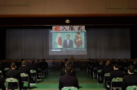
防衛大臣訓示 (姫路駐屯地)

本年度の入隊式は新型コロナウイルス感染症拡大のため、家族等の招待ができないうち、粛々と行われた。総勢約2,100名の入隊者は、新制服に身を包み、緊張した面持ちで入隊申告と服務の宣誓等を行い、希望に満ちた自衛官としての第一歩を踏み出した。