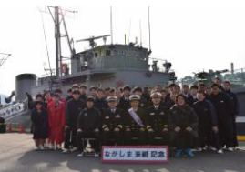
「ながしま」前での集合写真

自衛隊高知地方協力本部では引き続き各部隊と協同して、様々な体験を通じて募集対象者に自衛隊の魅力を感じさせ、就職の選択肢となる募集広報を実施して参ります。