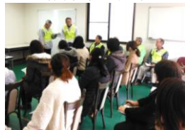
隊友会と連携した宿舎地区家族支援行事 (令和2年2月実施)