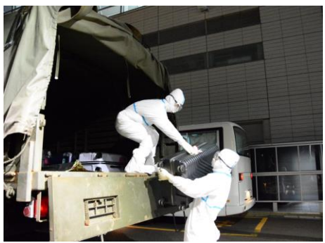
帰国者等の荷物の積載 (中部国際空港)