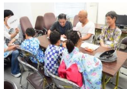
家族会との顔合わせ行事 (令和元年7月実施)

さらに、令和2年2月には隊友会の協力の下、宿舎に入居する隊員家族12名に対し、家族支援施策の概要説明、隊友会が計画している支援事項の説明及び普通寺市防災担当者による防災教育を実施しました。隊員家族の防災意識の向上と、宿舎地区被災時における家族支援の振作ができました。