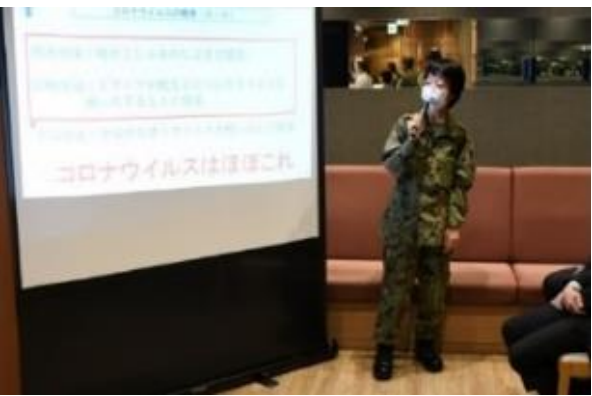
感染防止のための教育