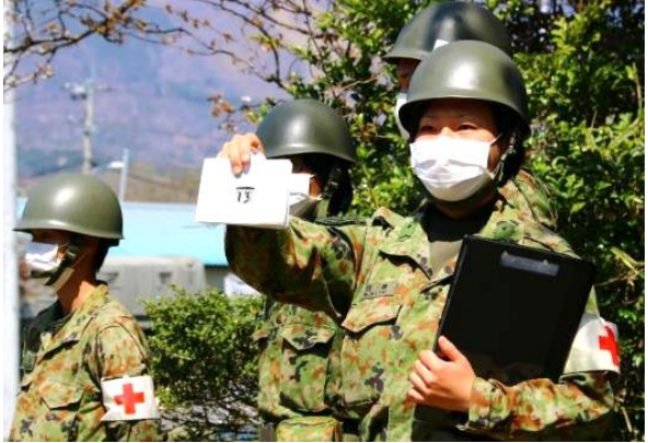
感染症対策教育 (日本原)

中部方面隊(総監 野澤陸将)は、4月13日(月)から20日(月)までの間、第3師団長及び第13旅団長を担任官とし、あいば野演習場及び日本原演習場において「令和2年度方面隊統制演習場春季整備」を実施した。 今回の演習場整備では、約2,300名が参加し、新型コロナウイルス感染症対策を徹底しつつ、各射場、機動路整備等を実施した。 総監は、演習場整備の状況を現地視察し、使用者視点に基づく演習場整備が成されていることを確認した。