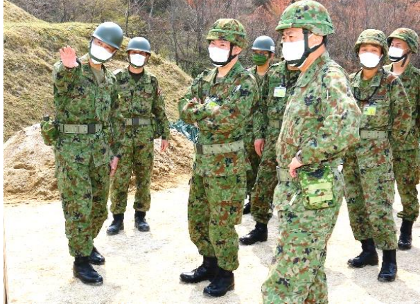
中部方面総監現地視察 (日本原)