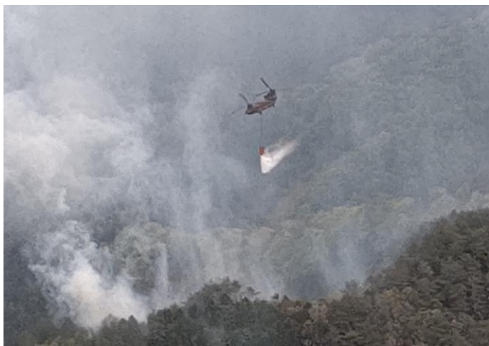
CH-47による空中消火活動

第3師団は、中部方面航空隊の支援を受け、第3飛行隊のUH-1×2機及び中部方面航空隊のCH-47×1機による26回（延べ80t）の空中消火活動により鎮火に寄与し、5月11日（日）午後2時40分兵庫県知事からの撤収要請を受けて、同活動を終了した。