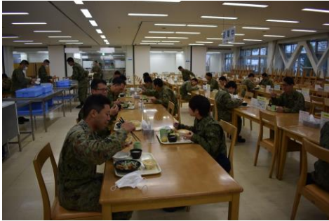
食堂では間隔を保ちつつ一度に 食事する人員数を制限