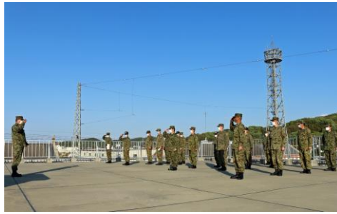
間隔を保って朝礼を実施