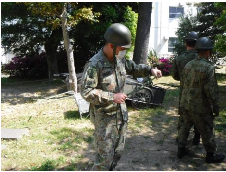
マスクを着けて ロープの結束を演練する隊員

中部方面隊（総監 野澤陸将）は、新型コロナウイルス市中感染拡大防止のための災害派遣のほか、三密の回避に留意しつつ、我が国を防衛するための任務に即応できるよう、訓練・業務を継続している。