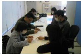
緊急登庁支援訓練 (2月)

さらに、訓練に併せて緊急登庁支援訓練を実施しました。これにより、子弟名簿を細部最新の情報に整備し、子弟を預ける隊員と開設施設の安全性を確認でき、入浴時の段差をなくすための足台を作成する等、隊員が任務に邁進できる実効性ある態勢を構築しました。