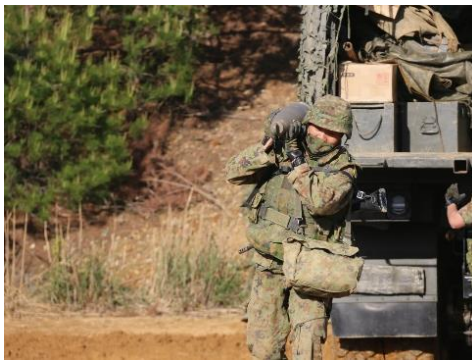
マスクを着けて 訓練に参加する隊員