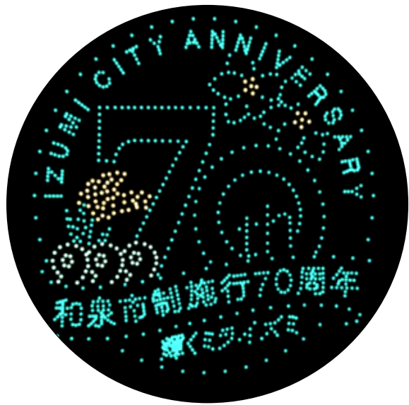
※ドローンショーイメージ図