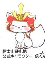
信太山駐屯地 公式キャラクター 信くん