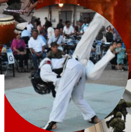
公式 X (旧: Twitter)