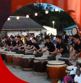
公式 ホームページ