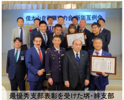
最優秀支部表彰を受けた堺・絆支部