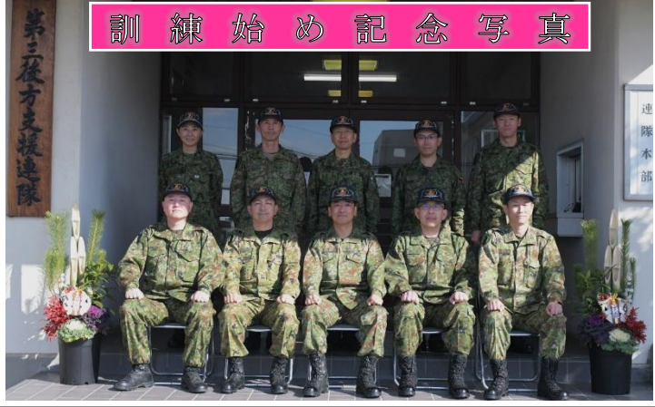
訓練始め記念写真