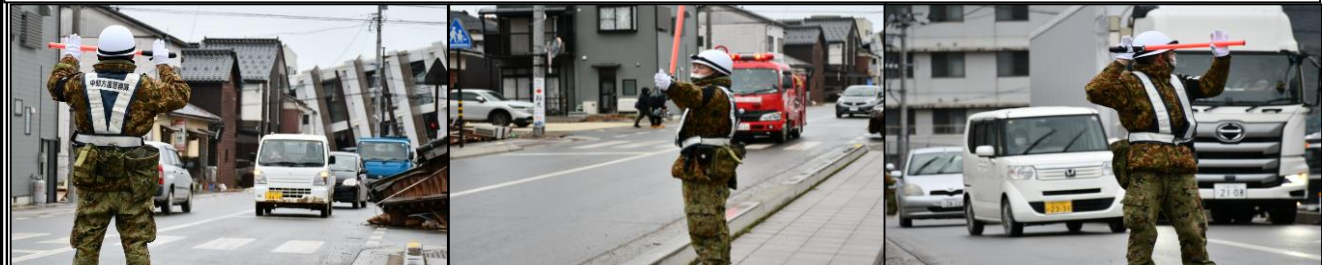
警 務 隊 の 交 通 統 制