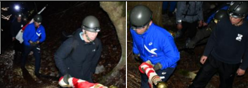
足 元 を 確 認 し な が ら 山 頂 へ