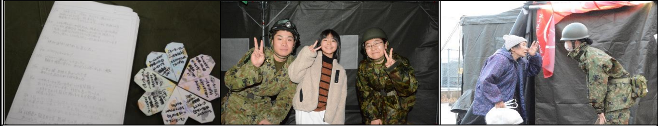
手 紙 ・ 多 く の 元 気 を も ら い ま し た