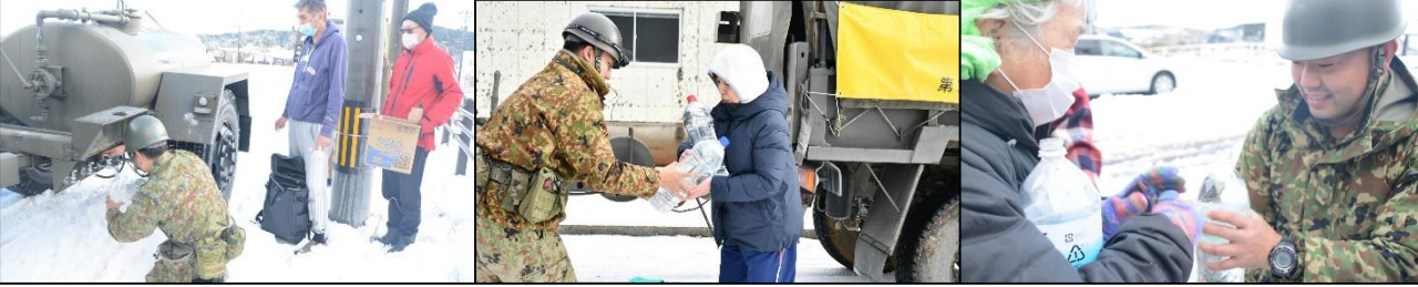
給 水 支 援 隊