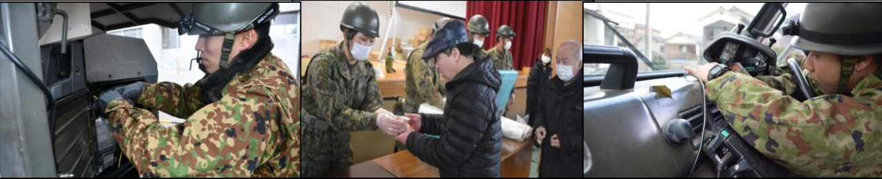
整 備 ・ 給 食 支 援 隊