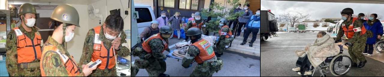
衛 生 支 援 隊