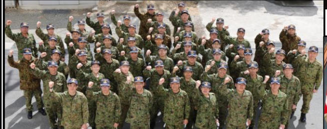
記 念 撮 影