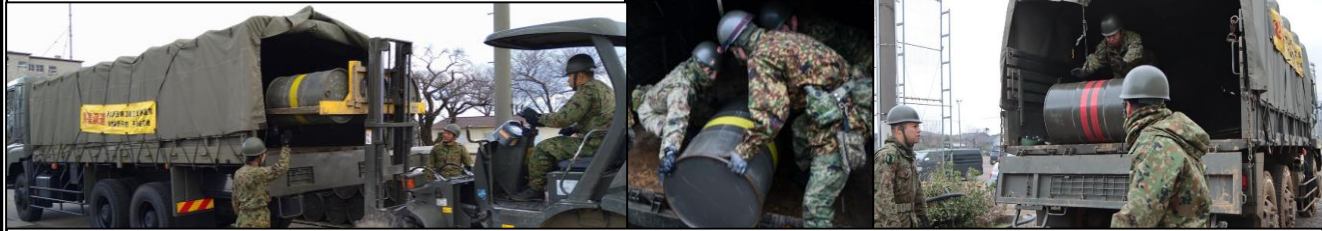
輸 送 支 援 隊