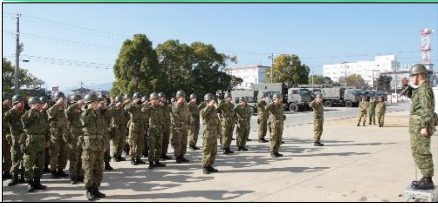
編 成 完 結 式

連隊は、令和6年1月1日(月)に発生した「令和6年能登半島地震」に係る災害派遣活動を開始した。 第3師団生活支援隊を編成し、被災者に寄り添った支援を行っている。 また、女性自衛官によるニーズ派遣隊を編成するなどして、様々な方向から支援を行っている。