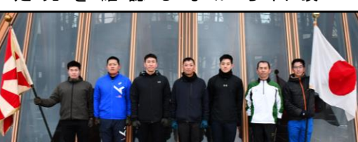
妙 見 山 山 頂 で の 記 念 撮 影

令和6年3月18日(月)、幹部候補生5名に対し幹部任官行事を実施した。早朝に妙見口から始まり妙見山山頂まで登り、ご来光に向かって各人、抱負を述べた。その後、幹部任官式を実施し、先輩幹部から激励をもらい、3等陸尉任官者5名は決意を新たにしました。