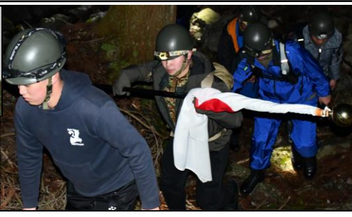
登 山 す る 幹 部 候 補 生 達