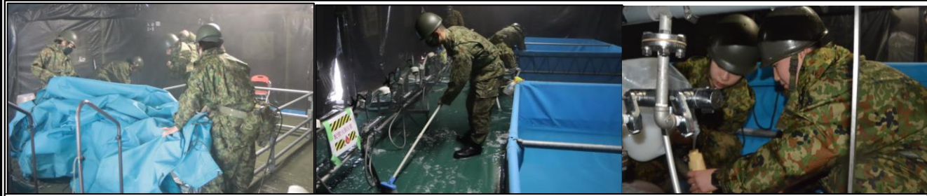
入 浴 支 援 隊