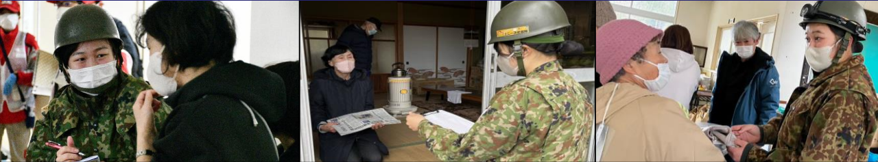
女 性 自 衛 官 ニ 一 ツ 派 遣 隊