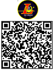
第3後方支援連隊HP QRコード

連隊の活動をお伝えできるよう随時更新・ポストしていきますので、よろしくお願ひします。