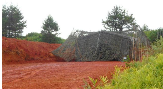
半地下整備所天幕