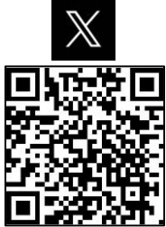
第3後方支援連隊「X」QRコード