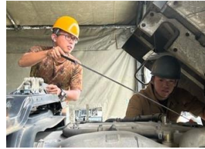
装輪車整備教育隊

令和5年7月1日(土)から9月15日(金)までの間、千僧駐屯地において令和5年度新隊員特技課程「装輪車整備」「需品」及び「衛生」を担任・実施した。それぞれの特技職に必要な基礎的知識及び技能を修得させるとともに、同期との絆を深め、陸上自衛官としての大きな一歩を歩み始めた。