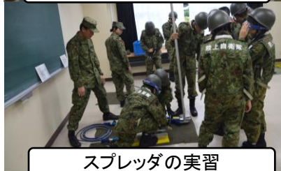
スプレッダの実習