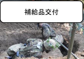
掩体を構築する 2DS隊員