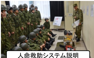
人命救助システム説明