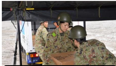
業者より物品受領

平成29年10月10日(火)から10月20日(金)までの間、あいば野演習場において第3次師団訓練検閲支援を実施した。また、第2整備大隊特科直接支援隊及び高射直接支援隊が、支援部隊とともに師団検閲を受閲した。