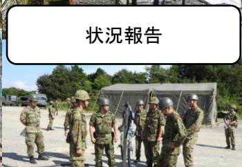
支援状況を確認する 連隊長