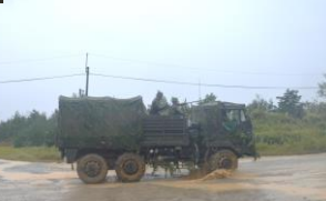
段列を推進する偵察先発隊