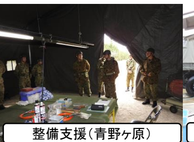
整備支援(青野ヶ原)