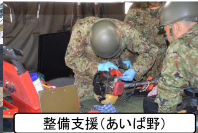
整備支援(あいば野)