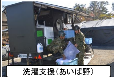
洗濯支援(あいば野)

平成29年11月7日(火)から11月15日(水)までの間、方面隊統制演習場秋季集中整備支援(あいば野)、11月17日(金)から11月21日(火)までの間、青野ヶ原演習場秋季集中整備支援(青野ヶ原)において各支援を実施した。