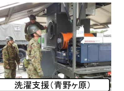
洗濯支援(青野ヶ原)