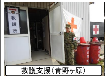
救護支援(青野ヶ原)