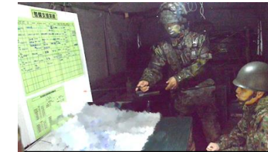
状況報告する特科DS長