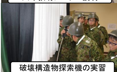
破壊構造物探索機の実習