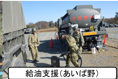
給油支援(あいば野)