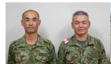
師団長褒章 (1整備付 埴2曹)

平成29年9月6日(水)から9月10日(日)までの間、あいば野演習場において、第2次師団訓練検閲支援を実施した。また、第2整備大隊第2普通科直接支援中隊が、支援部隊とともに師団検閲を受閲した。