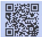
第3後方支援連隊HP QRコード