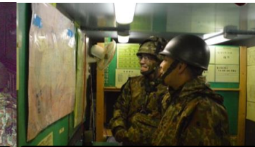
状況報告する高射DS長