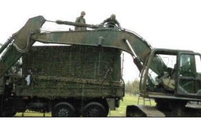
油圧ショベルの現地整備