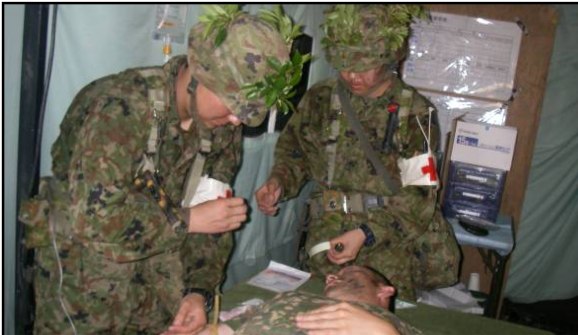
第1整備大隊・衛生隊訓練検閲