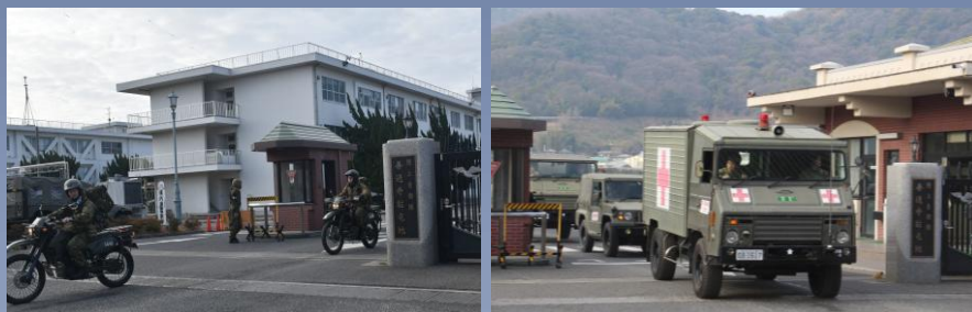
災害派遣要請に基づき、初動対処部隊が活動拠点に前進