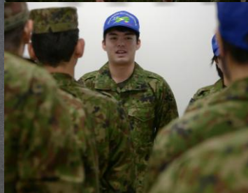
「隊長・副隊長・各小隊長・先任上級曹長・昇任者による抱負発表」