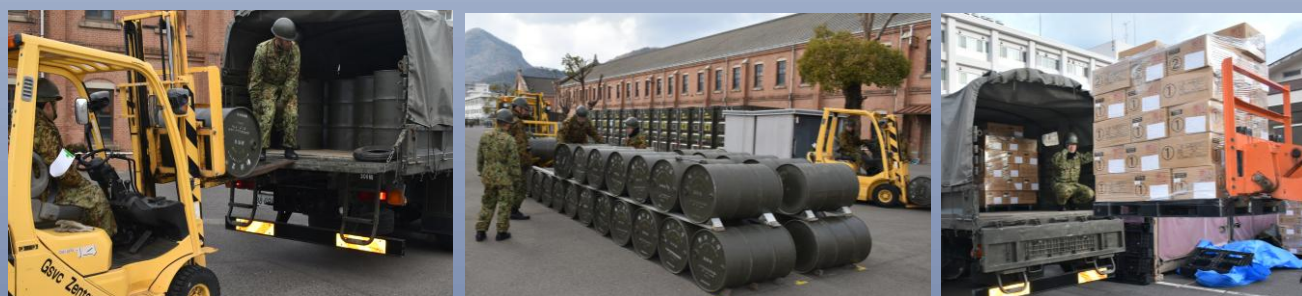
駐屯地への物資補給として、燃料及び糧食を搬入し、活動継続能力を確保