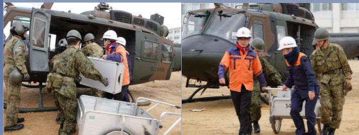
【総務省 四国総合通信局】

善通寺駐屯地において、通信事業者と災害協定に基づいた連携要領を確認し、災害発生時に事業者より提供を受けする通信器材・通信回線等について相互の認識を合わせました。また、応急復旧器材を迅速に被災地へ運搬することを想定した、UH-1Jへの器材の積載・卸下の訓練を実施しました。