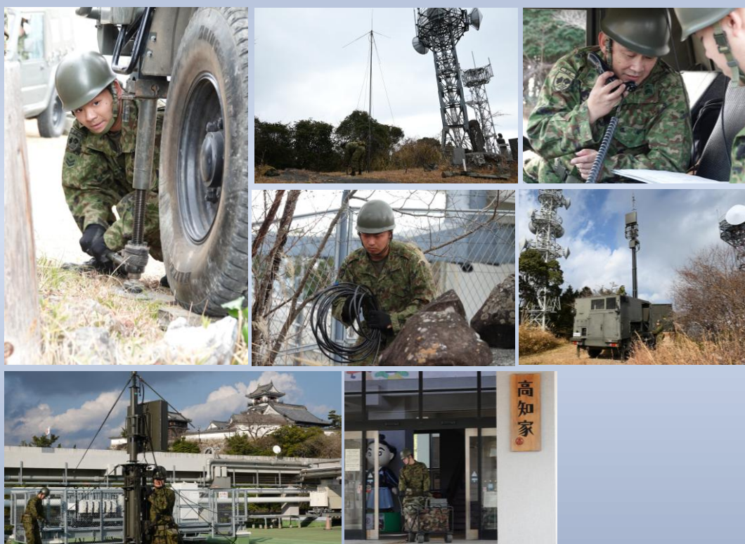
通信所を開設し、旅団の災害派遣活動を支える通信基盤を構築

第14旅団(旅団長 仲西勝典 陸将補)は、1月19日～25日までの間、『07南海レスキュー』を実施しました。本訓練は、南海トラフ巨大地震を想定し、災害対処能力の向上と、関係機関との緊密な連携体制の確立を目的としています。中部方面隊における最大規模の災害対処訓練として、初動対処、人命救助、物資補給等、総合的に訓練し、実動に即した対応能力の向上を図りました。