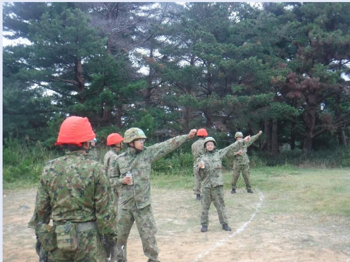
【火工品の取り扱い実習】

本教育では、化学物質の性質や危険性を学ぶとともに、化学火工品の安全な取り扱いや防護・処理要領について修得します。隊員一人ひとりの専門知識と技術を高めるため、実践的な訓練を重視して実施しました。