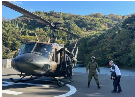
【第14飛行隊による孤立地域からの住民避難訓練】