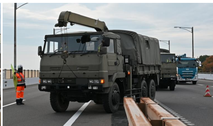
【開口部の乗り越え訓練】