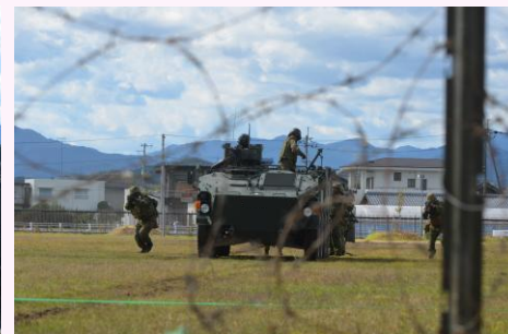
【模擬戦闘訓練展示】