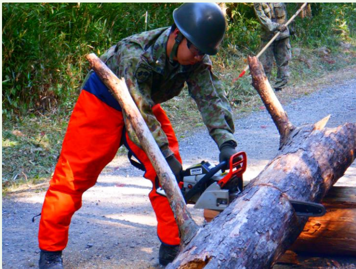
【チェーンソーで樹木を切断する隊員】

今回は、約10日間にわたって、我々の「道場」である演習場に感謝の気持ちを込めて、演習場として必要な機能が損なわれないよう、機能維持のため基盤構築を実施しました。チェーンソーや草刈り機を慎重に使いこなし、訓練環境の質向上と安全確保につなげました。