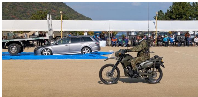
【偵察オートバイによる情報収集】