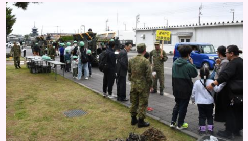
【96式装輪装甲車体験搭乗】