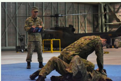
【杉村指導官による練成】