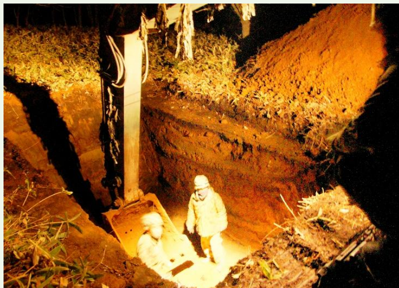
【夜間における掩体構築】