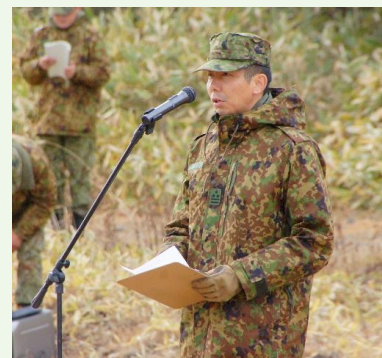
【編成完結式での訓示を述べる水関連隊長】

冬の北海道という厳しい寒さの中、戦闘力の組織化、障害・情報・火力の連携、射撃及び観測を継続できる掩体の構築等を実施し、部隊の任務遂行能力を向上させるとともに、抑止及び対処の実効性の向上を図りました。