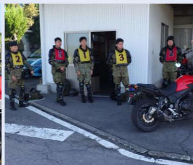
【琴平ドライビングスクールでの自動二輪教習】