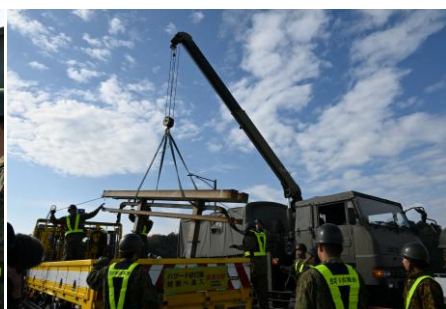
【ユニックによる支柱撤去】