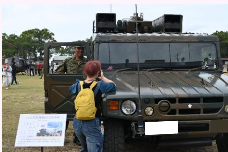
【装備品展示(93式短距離地对空誘導弾)】