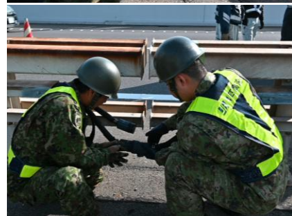
【開口部の電源線切り離し】