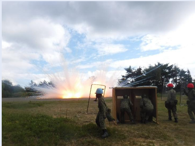
【化学火工品の処理】