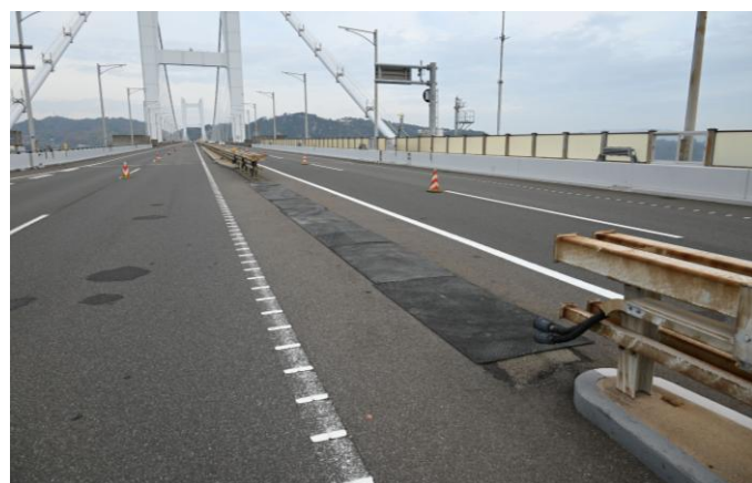
【道路啓開作業完了後の開口部】