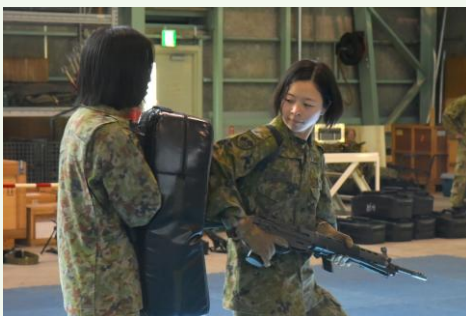
【格闘検定を受検する隊員たち】