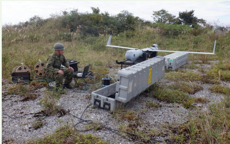
【無人偵察機の発進準備】