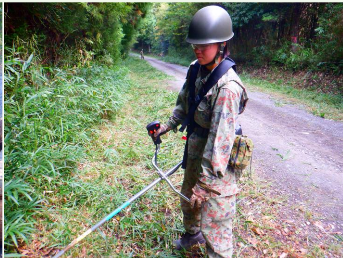
【草刈り機で草を刈る隊員】