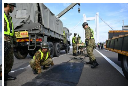
【ゴムマットの設置】