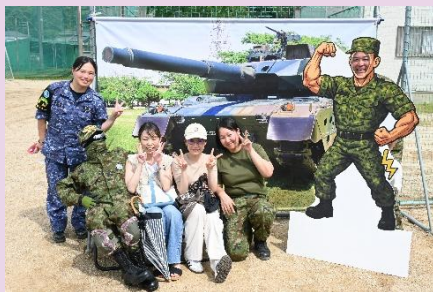
【広報官と記念撮影】