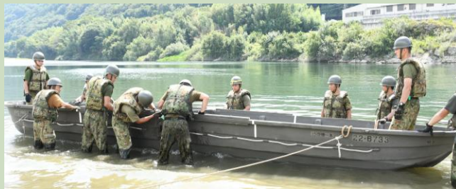
【渡河ボートを河で組み立て】

また、各種ボートを利用した人命救助訓練を実施して災害対処能力も向上させました。今後も災害に備えた訓練を継続していきます。