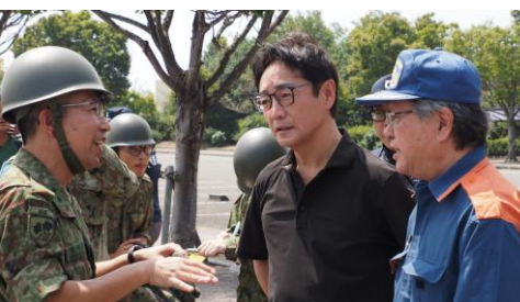
【後藤田知事及び板野町長からの激励】