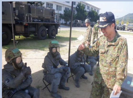
【隊長から各部隊の隊員に激励】