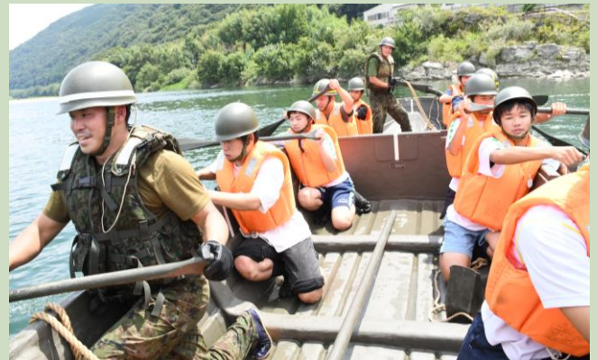
【隊員と一緒にボートを漕ぐ高校生たち】