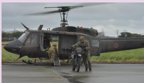
【UH-1Jと第14偵察隊が共同した訓練展示】