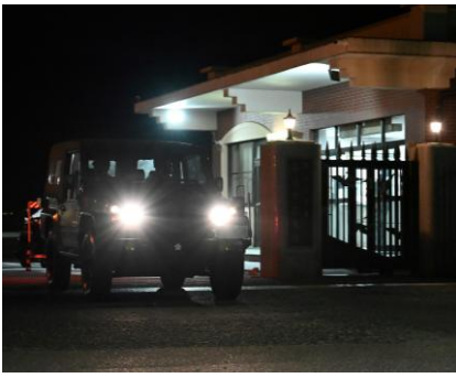
【初動連絡員の出發】