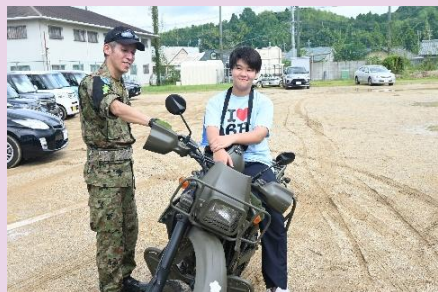
【偵察オートバイの展示】

高知中央高校において装備品展示を行いました。学生たちは普段見ることのない装備に興味津々の様子で、自衛隊の役割や任務への理解・関心も深めてもらう機会となりました。今後も、地域との繋がりを大切にしながら、広報活動に取り組んでまいります。