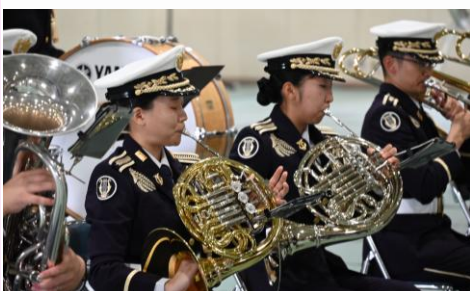
【第14音楽隊による追悼演奏】

志半ばに殉職された隊員が安らかであること、そして御遺族の皆様が突然の悲しみや苦難を乗り越えられて、心穏やかな日々をお過ごしになられることを願い、第14音楽隊が「瞳をとじて」を追悼演奏し、拝礼に続く儀じょう隊による弔銃が厳かに鳴り響き、殉職隊員52柱のご冥福をお祈りしました。