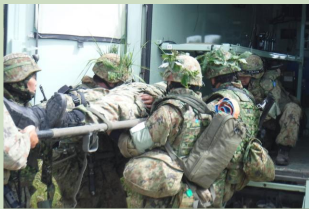
【傷病者を救急車から降ろす様子】