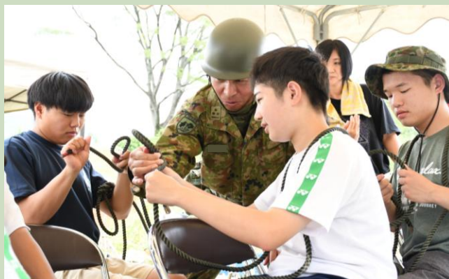
【ロープワークを教えている本部管理中隊長】

この訓練には「お仕事見学」として高校生9人も参加し、隊員からロープワークを学んだ後、渡河ボートに乗り込み、息を合わせてオールを漕いで、吉野川で隊員とともに汗を流しました。