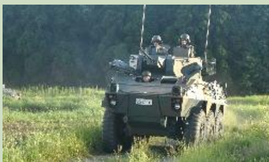
【偵察地域へ前進するLAV(写真左)とRCV(写真右)】