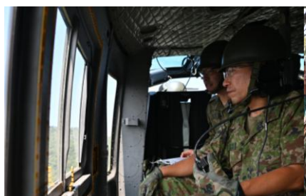
【仲西旅団長による現地指導】

活動間、SNS等を通じて多くの方々から温かい応援を受け、地上から上空へのメッセージも届きました。今後も引き続き、地域と連携し、迅速かつ的確な災害派遣に努めてまいります。