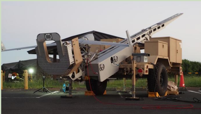
【無人偵察機発射準備完了！】

隊員個人の技量向上はもちろん、部隊全体の即応能力の強化に繋がる訓練となりました。今回の成果をもとに、さらなる無人機運用能力・情報収集能力の強化に取り組めます。