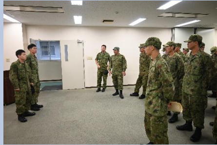
【部隊に配属された隊員】

第3次連隊野営において、戦い方の深化に繋がる各種訓練を実施しました。実戦を想定した陣地構築、火力運用、警戒行動などを重点的に行い、個々の技量向上と部隊運用能力の強化を図りました。