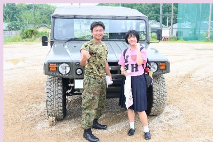
【高機動車の前で記念撮影】