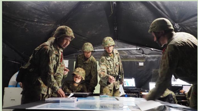
【画像データ処理の様子】