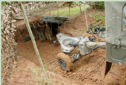
【120mm迫撃砲の設置準備】