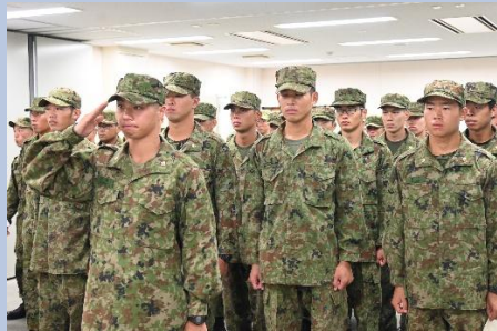
【特技課程を修了した新隊員】