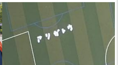
【地上から上空へ届いたメッセージ】