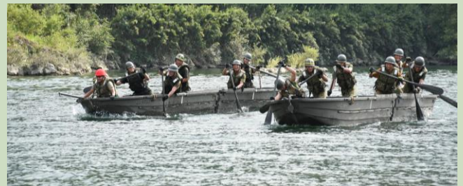
【渡河ボートで競争中】

この訓練には「お仕事見学」として高校生9人も参加し、隊員からロープワークを学んだ後、渡河ボートに乗り込み、息を合わせてオールを漕いで、吉野川で隊員とともに汗を流しました。