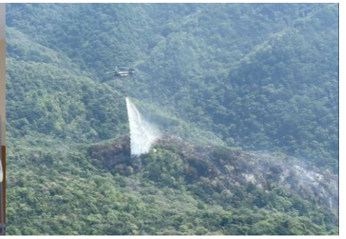
【空中消火活動の様子】