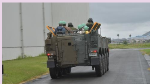
【WAPC体験搭乗】 （第15即応機動連隊）