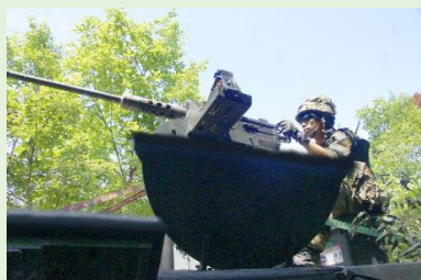
【車載機関銃による射撃】

第2次旅団演習では、関係部隊と連携して敵を撃破・阻止等、様々な任務に対応するための練度向上を図りました。