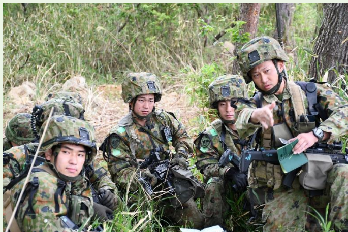
【分隊員に対する命令下達】