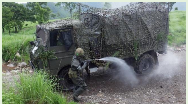
【除染所にて汚染した車両を除染】