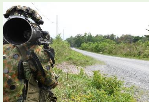
【対戦車火器を指向する隊員】

この訓練で得た教訓等をもとに、連隊は、今年度も引き続き一丸となって任務に邁進していきます！