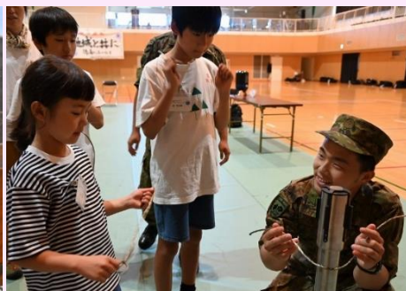
【夏休みちびっこ大会】 （ロープワーク体験）