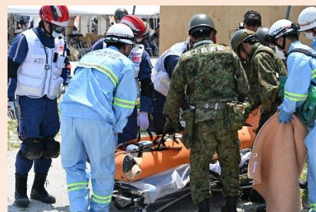
【倒壊家屋の入口を確保し、被災者を救出し、医療従事者へ引き継ぐ様子】