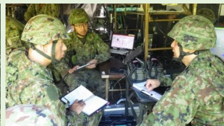
【綿密な調整を実施する幕僚】