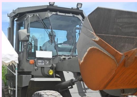
【職場体験学習】 （体験搭乗）