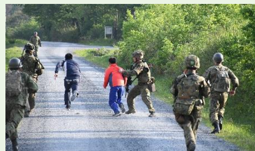
【逃走する不審者の捕獲】