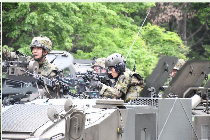
【敵徒歩兵に対する車上射撃】