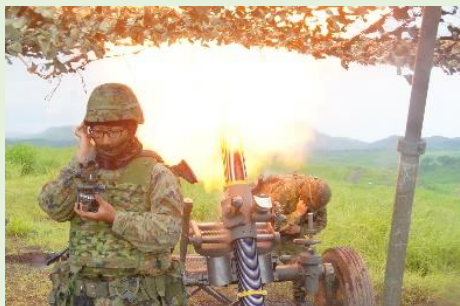
【120ミリ迫撃砲の射撃】

第1次旅団演習では、120ミリ迫撃砲、81ミリ迫撃砲及び中距離多目的誘導弾の戦闘射撃など、主に部隊間が連携して行動する訓練を行いました。