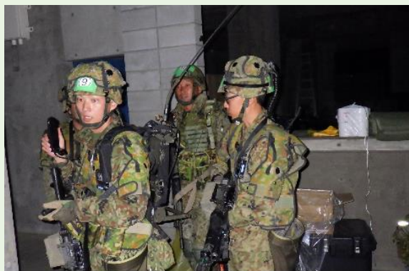
【「不審者発見！」出動の様子】