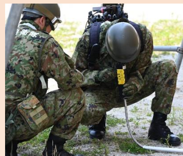
【警察犬の反応を手掛かりに、遠隔カメラで倒壊家屋内を確認する様子】