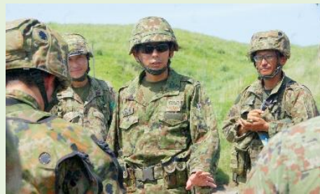
【水関連隊長による現地視察】

第2次旅団演習では、関係部隊と連携して敵を撃破・阻止等、様々な任務に対応するための練度向上を図りました。