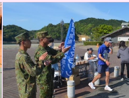
【室戸阿南海岸国定公園 ウルトラマラソン大会】 （物資輸送支援）