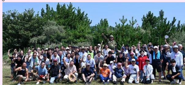
【友の会（駐屯地協力団体）夏季交流会BBQ】

さらに、駐屯地協力団体や地域の小学校との交流も活発的に行い、子供たちに自衛隊の「カッコよさ」と「やりがい」を直接伝えることで、未来を担う若者たちに夢や希望を与え、自衛隊の魅力を力強く発信しています。これらの活動は、徳島県における募集基盤の拡大にも大きく貢献しており、第14施設隊はこれからも「地域と共に」歩んでいきます。