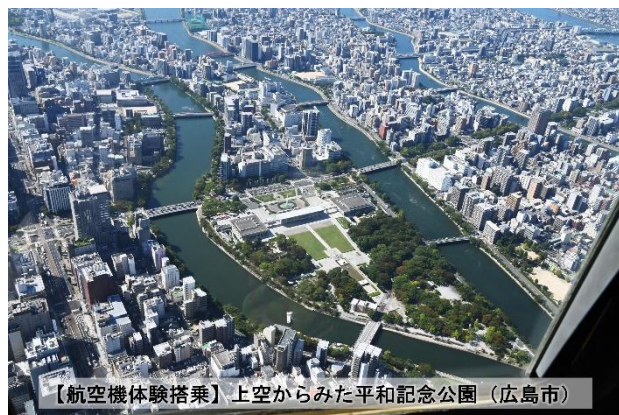
【航空機体験搭乗】上空からみた平和記念公園（広島市）