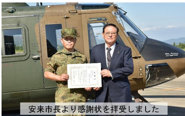
安来市長より感謝状を拝受しました