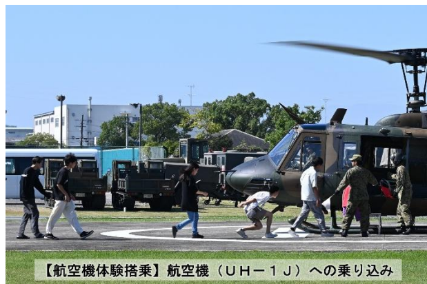
【航空機体験搭乗】航空機（UH-1J）への乗り込み

海田市駐屯地（広島県）では、航空機（UH-1J）の体験搭乗を実施しました。普段は見ることのない空からの景色を体験していただき、自衛隊を身近に感じていただけたのではないかと思います。