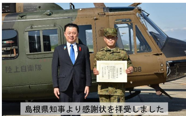
島根県知事より感謝状を拝受しました