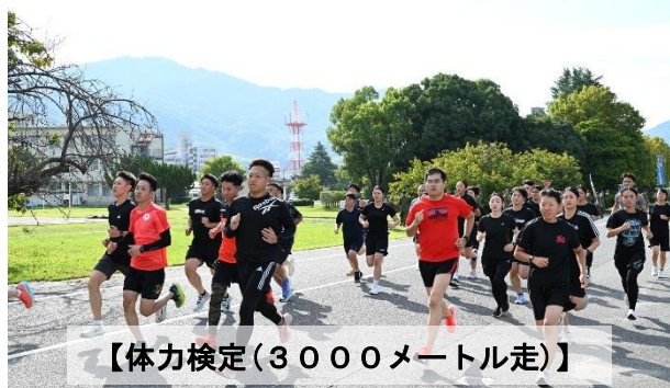
【体力検定（3000メートル走）】