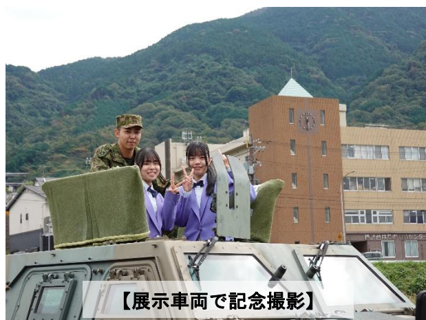
【展示車両で記念撮影】