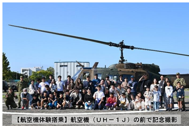
【航空機体験搭乗】航空機（UH-1J）の前で記念撮影