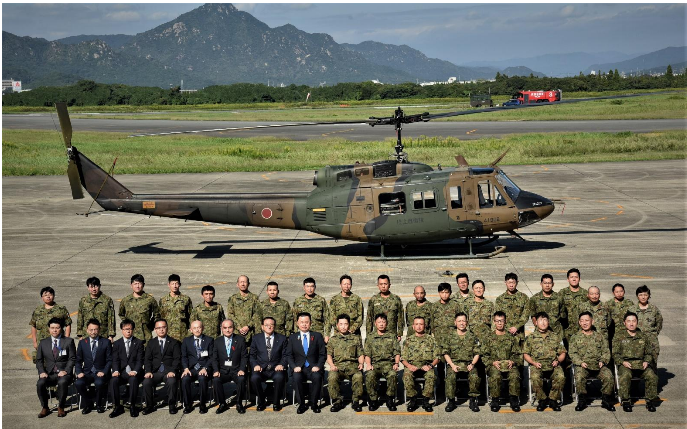
島根県安来市林野火災に対する感謝状受領記念