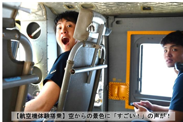
【航空機体験搭乗】空からの景色に「すごい！」の声が！