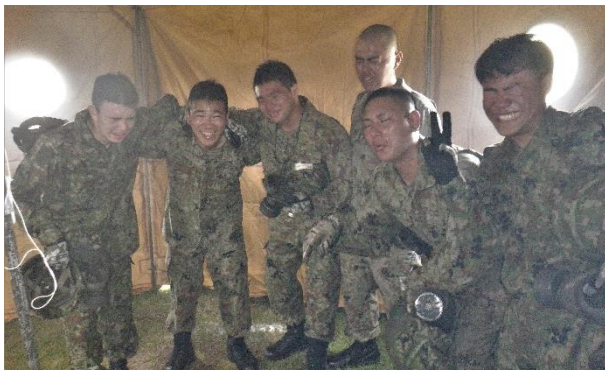
催涙ガスの体験（海田市駐屯地）