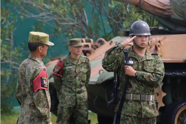
基本教練訓練公開（米子駐屯地）

自衛官候補生は、入隊して約2ヵ月となりました。集団生活にも徐々に慣れ戦闘訓練の他、行進訓練や催涙ガスの体験等を行い、一步ずつ自衛官としての道を歩んでいます。今後教育隊は、各種練度判定や総合訓練を実施し、教育の総仕上げを行っていきます。