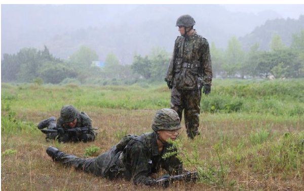
戦闘訓練（山口駐屯地）