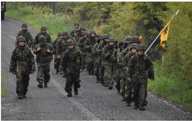
25km行進訓練（日本原駐屯地）