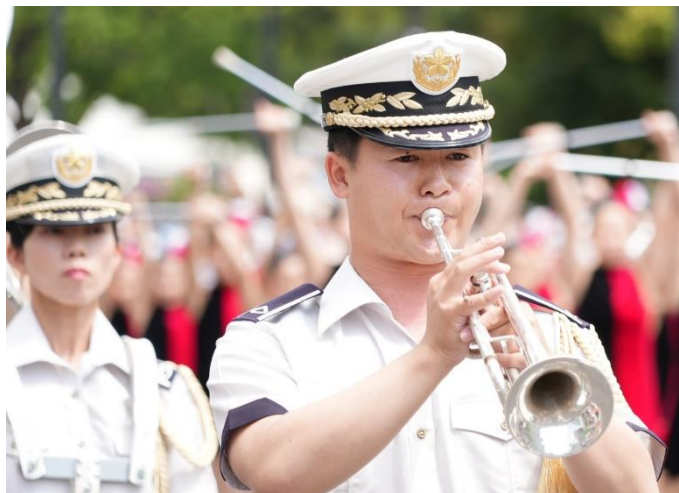
パレードでの演奏

第13音楽隊は、5月3日（土）及び4日（日）、広島市内で行われた「2025ひろしまフラワーフェスティバル」に参加し、パレード及びステージで音楽演奏を行い、行事の盛会に花を添えました。