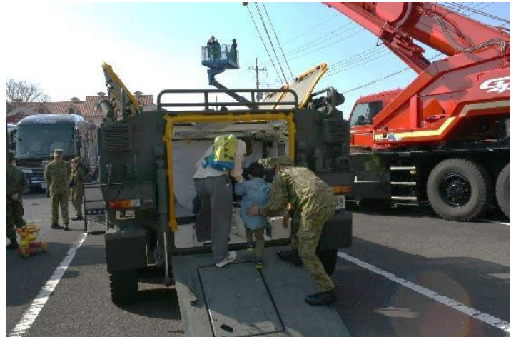
イベント会場での装備品展示の様子