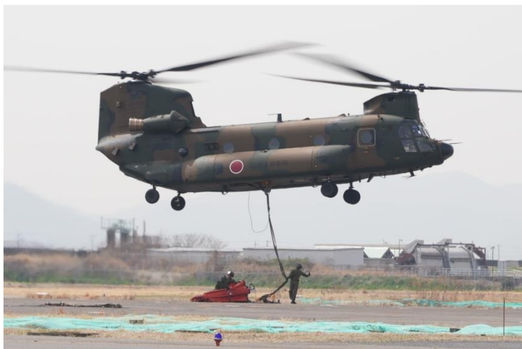
空中消火用バケツの取付け (CH-47)