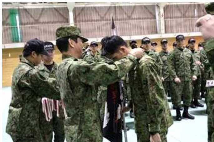
連隊長からき章を授与

3月4日（火）、訓練終了に伴い、格闘指導官き章授与式を実施し、22名の新たな部隊格闘指導官が誕生しました。