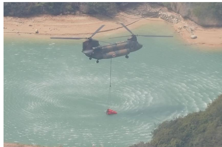
貯水池より消火水汲取り