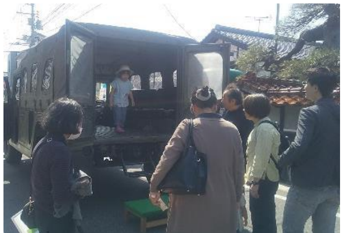
イベント会場での装備品展示の様子