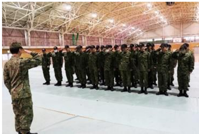
新たな部隊格闘指導官が誕生