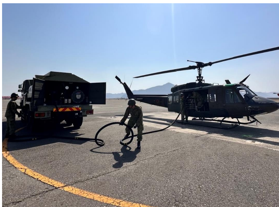
岡山県岡山市山林火災に係る災害派遣活動