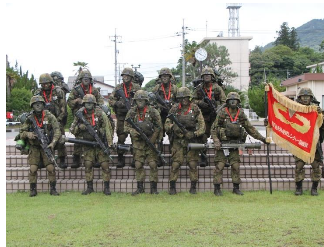
新たなレンジャー隊員誕生！