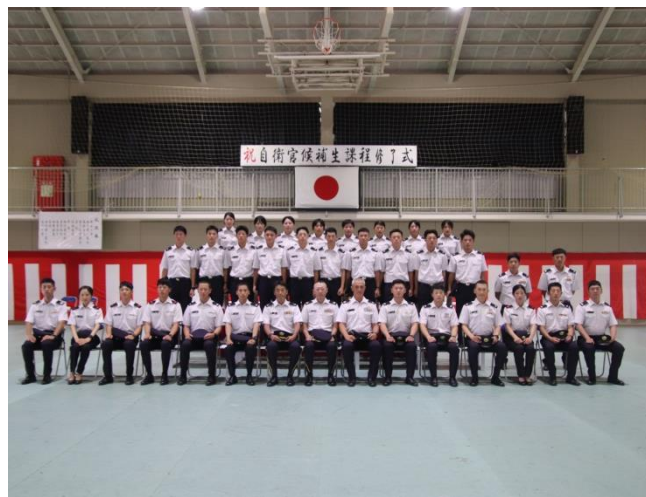
〈 米子駐屯地 〉