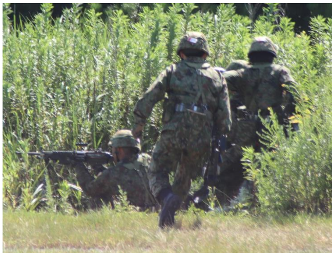
戦闘訓練(第8普通科連隊)

自衛官として基本知識を学んだ新隊員は、部隊で勤務するために必要な特技（専門の技術）についての基本的な知識や技術を身につけるため、新隊員特技課程・一般陸曹候補生課程「後期」の学生として訓練等に励んでいきます。