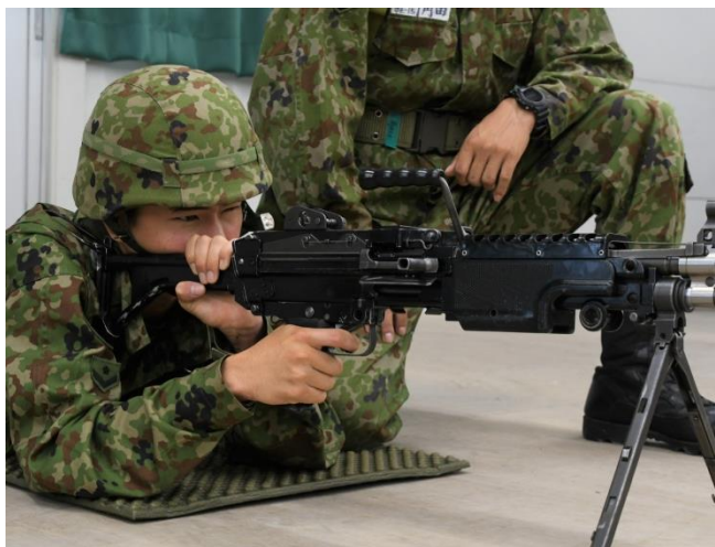
機関銃教育(第46普通科連隊)