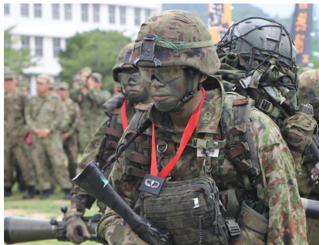
厳しい訓練に耐えた苦勞が報われた瞬間