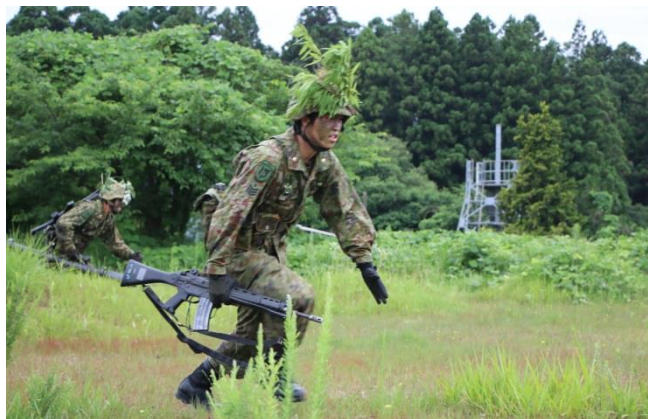
素早く目標へ前進

6月26日、第17普通科連隊は陸曹候補生課程の履修前教育として戦闘訓練を実施しました。隊員は、陸曹になるために必要な指揮能力・知識及び技術を習得するため、熱心に訓練に励みました。