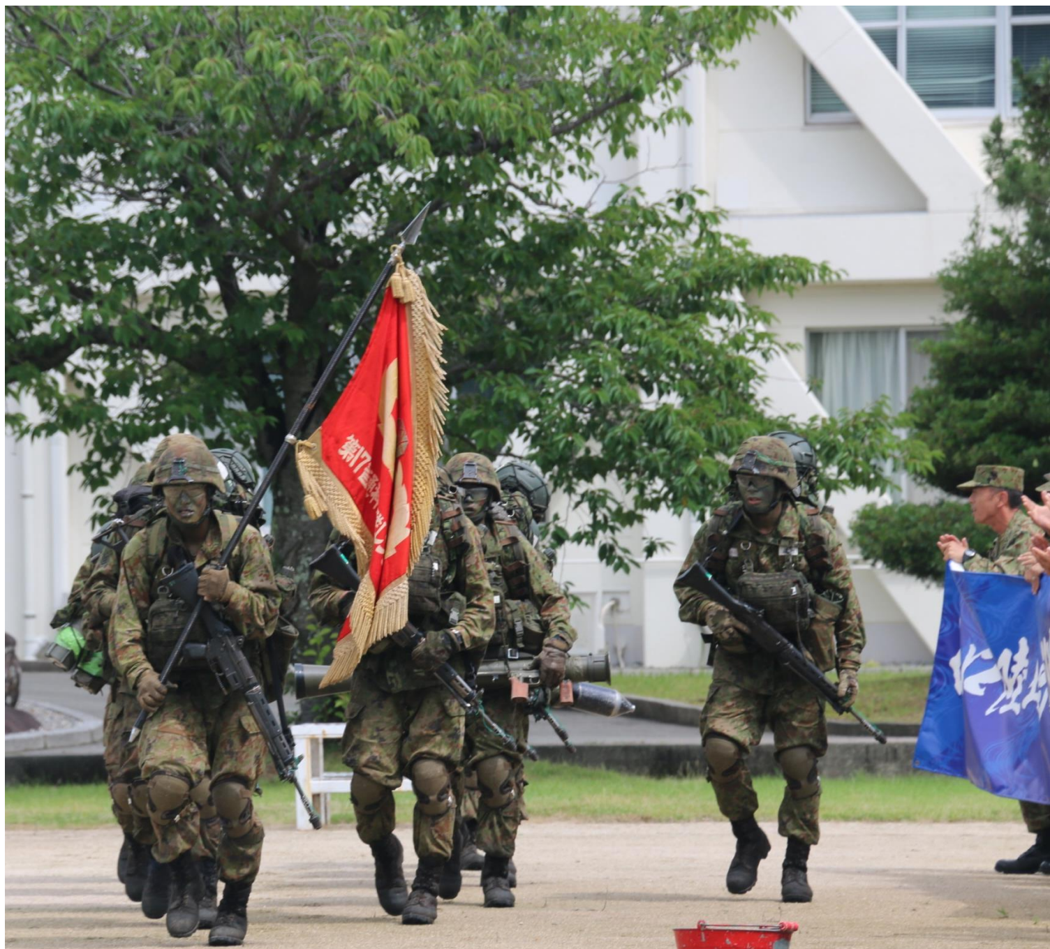
部隊集合教育「レンジャー」帰還式