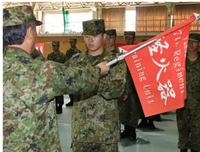
教育開始式(第17普通科連隊)