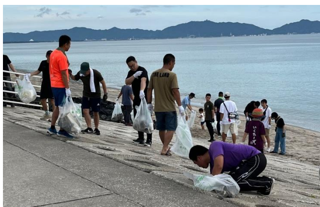
浜辺のゴミを収集

7月20日、米子駐屯地（鳥取県）は駐屯地の有志により米子市弓ヶ浜及び松林の清掃活動を実施しました。