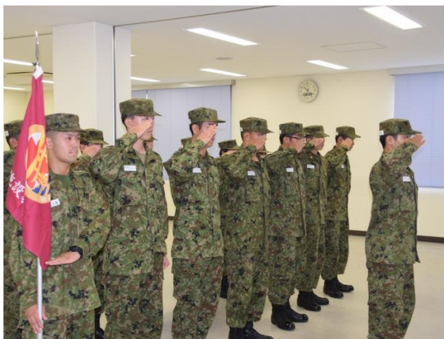
教育開始式(第13施設隊)