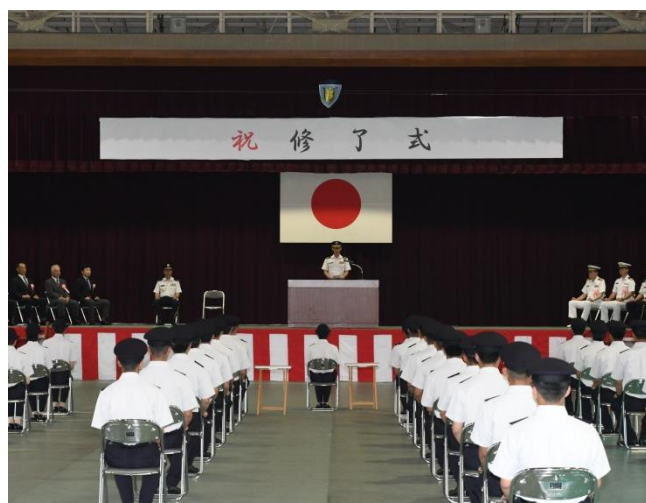
〈 海田市駐屯地 〉