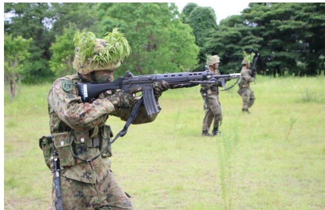
隊員を指揮しつつ自らも射撃