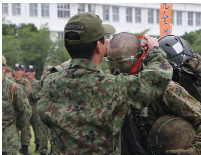
レンジャーき章の授与