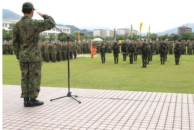
連隊長へ帰還報告