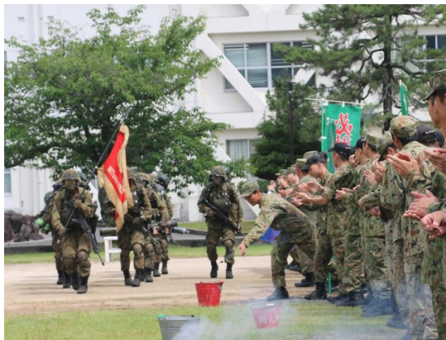
駐屯地隊員による出迎え

6月24日（月）、第17普通科連隊は、部隊集合教育「レンジャー」の帰還式を実施しました。レンジャー学生はすべての厳しい任務を完遂し、駐屯地の隊員やレンジャー学生の家族から盛大に迎えられ山口駐屯地に帰還しました。レンジャーき章を授けられた学生は、レンジャー隊員として国防の任に従事します。