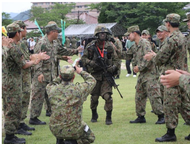
所属部隊の隊員も学生を労う