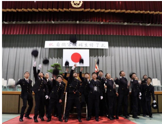
〈 山口駐屯地 〉