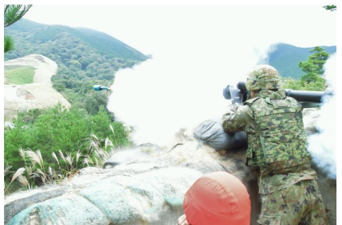
個人携帯対戦車弾