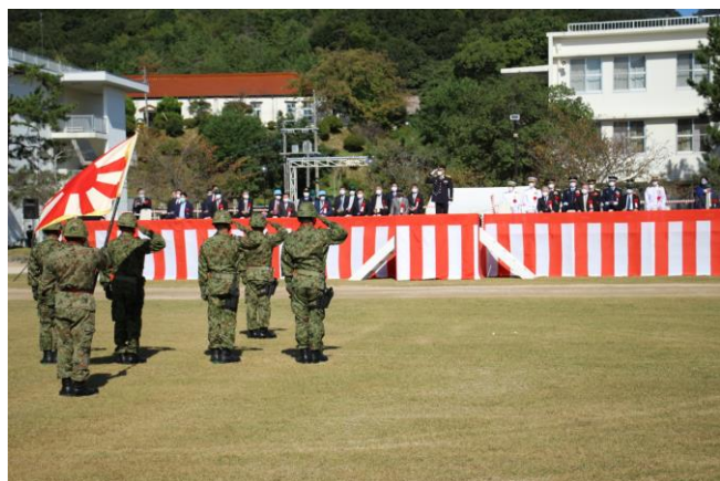
厳粛に行われた観閲式

山口駐屯地は10月10日（日）、同駐屯地において山口駐屯地創設66周年記念行事を開催し、観閲式、観閲行進、山口維新太鼓演奏、模擬戦をはじめ、装備品展示、第13音楽隊による演奏会、戦車試乗、VR体験など様々な催しを行い、来場者とともに66周年を祝いました。