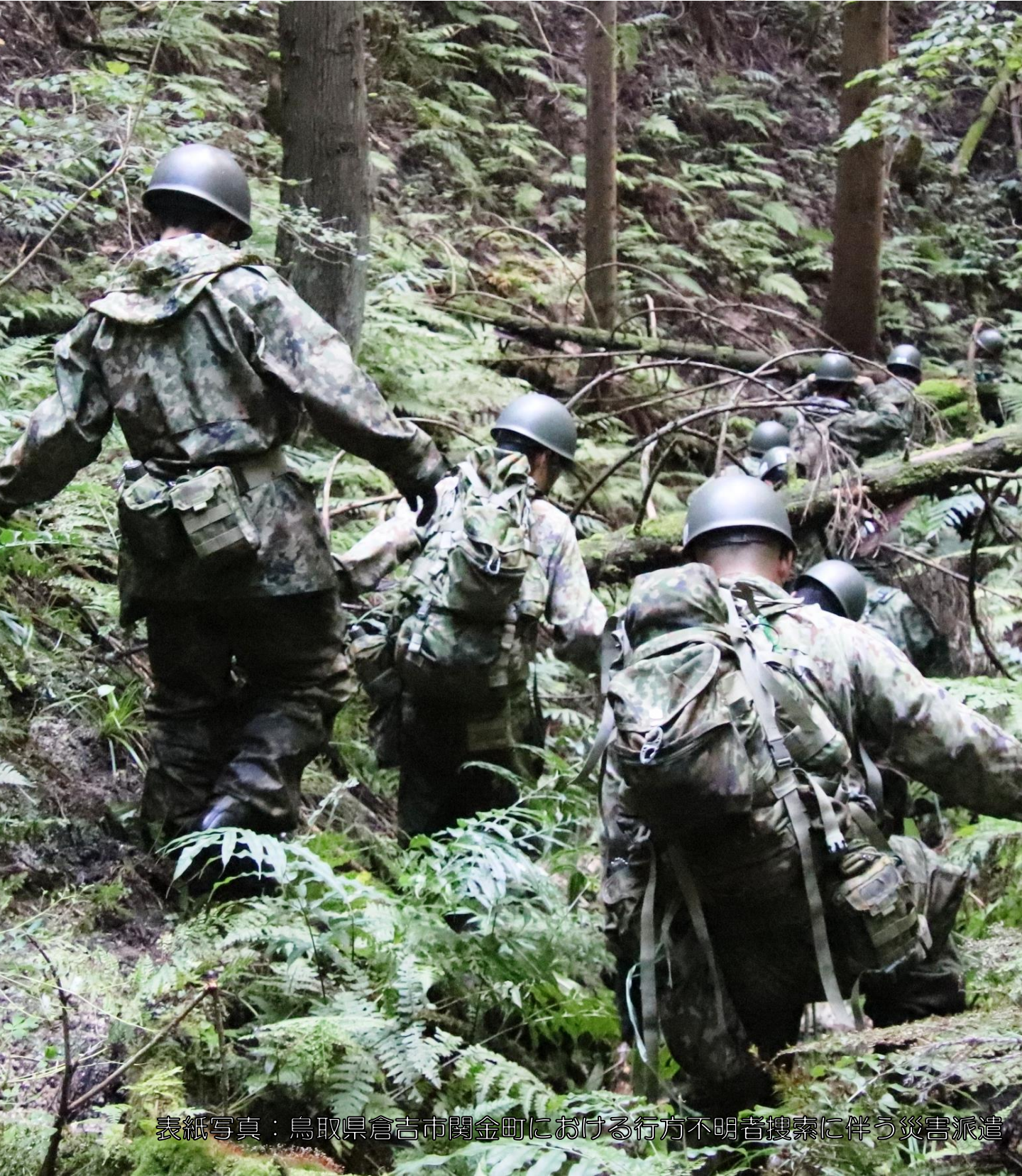
表紙写真：鳥取県倉吉市関金町における行方不明者捜索に伴う災害派遣