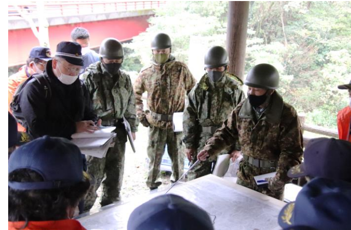
現地において関係機関と調整

第8普通科連隊は、10月20日（水）鳥取県知事からの要請を受け、鳥取県倉吉市の山中において行方不明となった男性を救出するため、捜索活動を行いました。その後に同連隊は22日（金）、男性を発見し、捜索活動を終了しました。