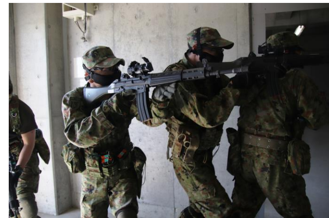
隊形を組んで前進

第8普通科連隊は9月23日（木）から26日（日）までの間、あいば野演習場において市街地戦闘訓練を行い、練度向上を図りました。