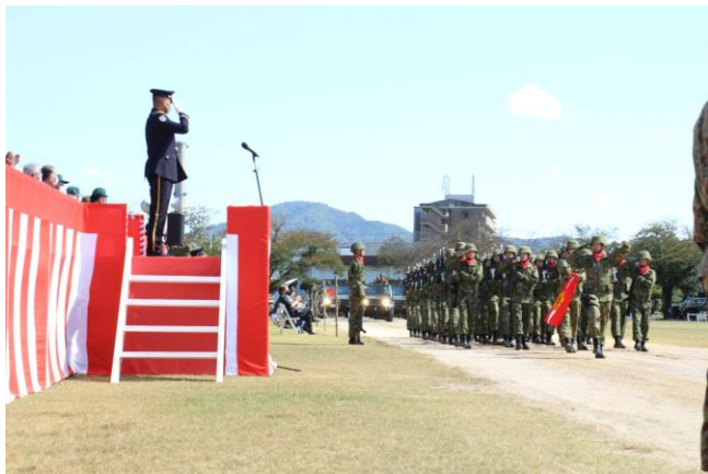
澆刺とした観閲行進を披露