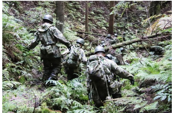
険しい山中を捜索