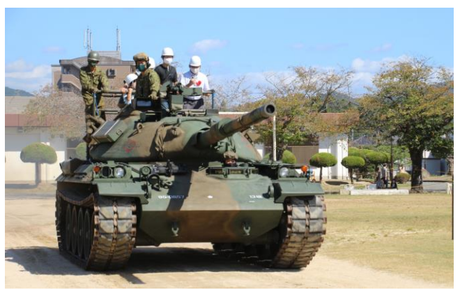
大人気の戦車試乗