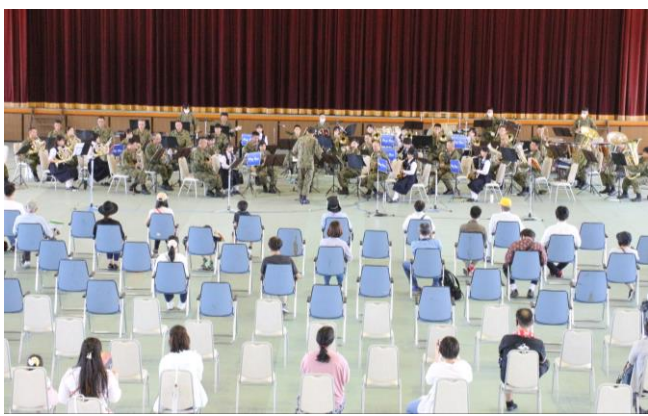
萩光塩学院高校吹奏楽部と第13音楽隊との共演