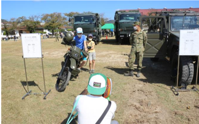
偵察用オートバイに乗って記念撮影