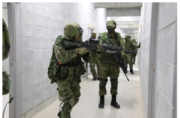
部屋の索敵を訓練