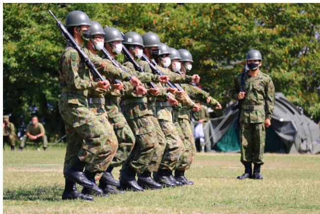
分隊教練で部隊を指揮

旅団は10月6日（水）及び7日（木）、海田市駐屯地において陸曹候補生選抜第2次試験を行いました。