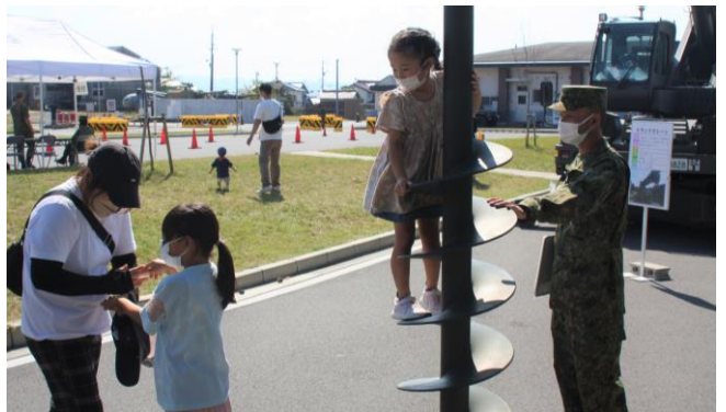
地面に穴を掘るアースオーガを展示