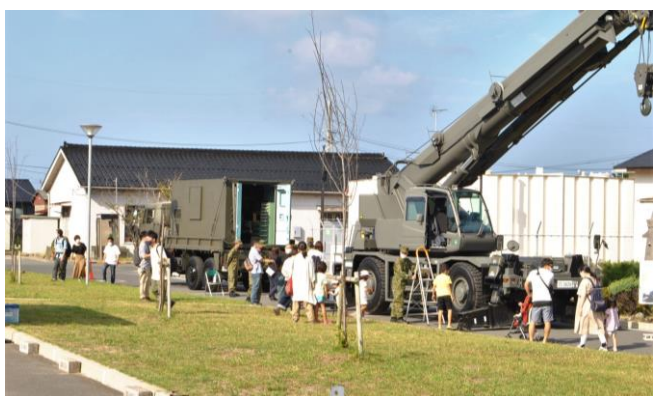
大きな重機も展示