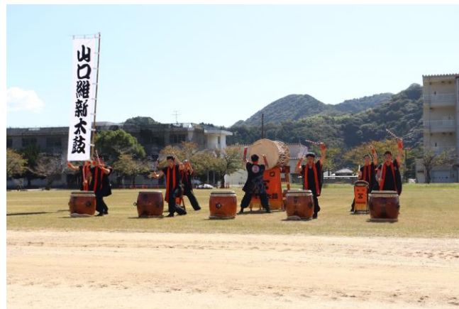
山口維新太鼓による演奏