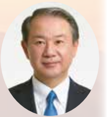
飯塚市長 武井 政一

本年も飯塚駐屯地及び第2高射特科団の皆様のご多幸を祈念申し上げ、新年のご挨拶とさせていただきます。