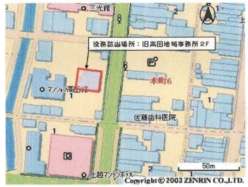
(旧高田地域事務所配置図)