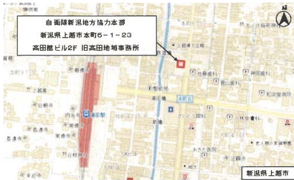
(旧高田地域事務所案内図)