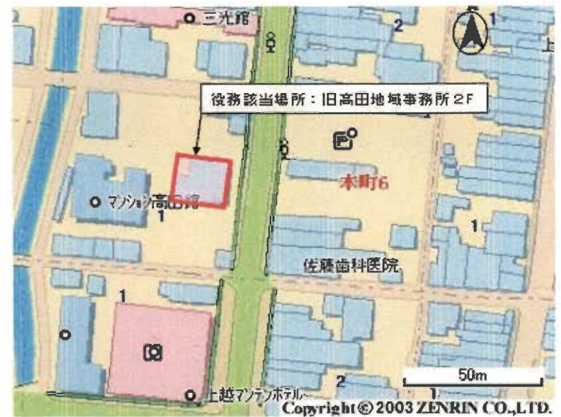
(旧高田地域事務所配置図)