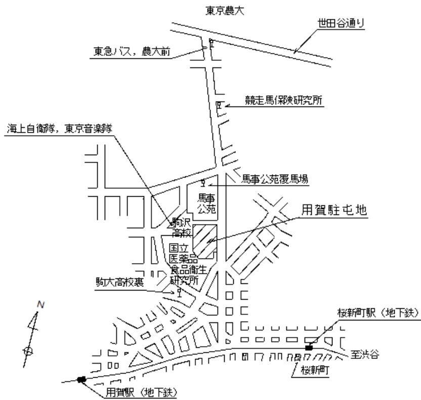
案内図 1 / 75000