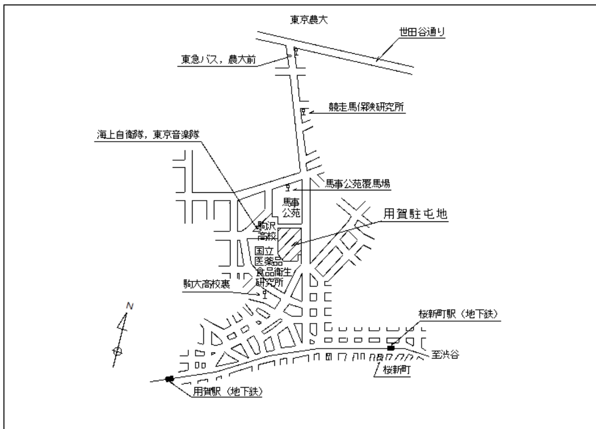
案内図 1 / 75000