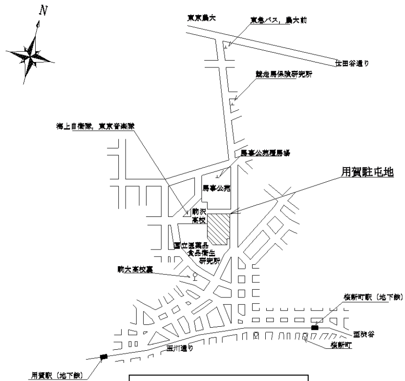
案内図 S = 1 : X