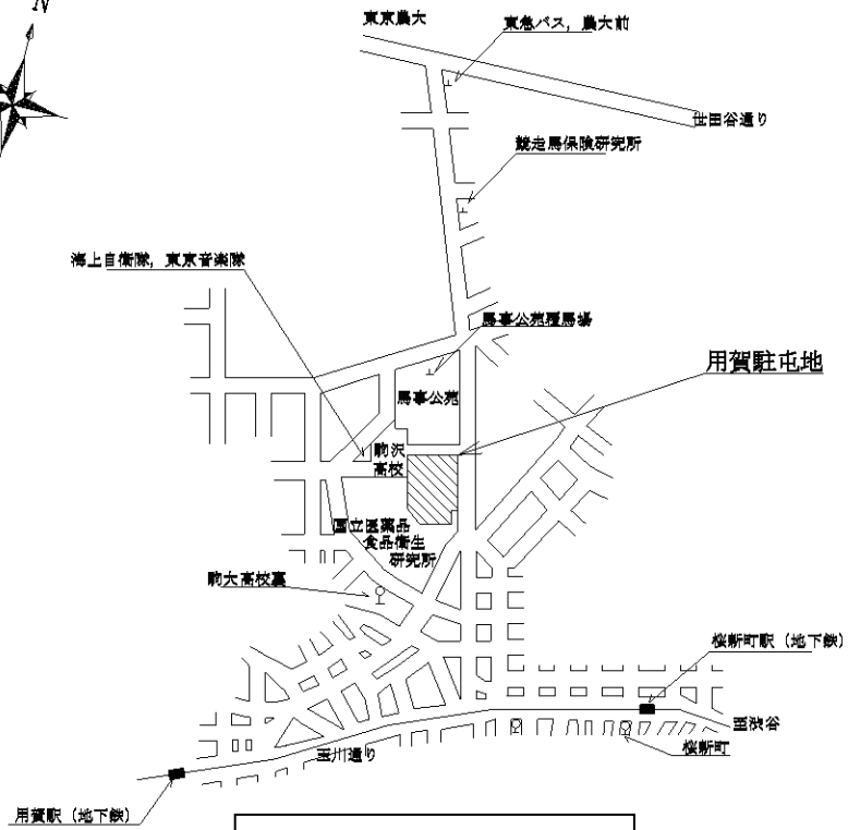
案内図 S = 1 : X