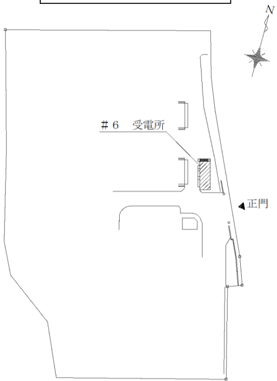
配置図 S = 1 : X