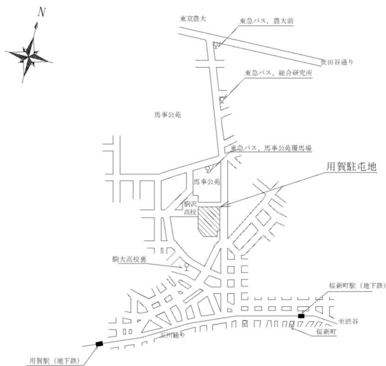
案内図 S = 1 : X